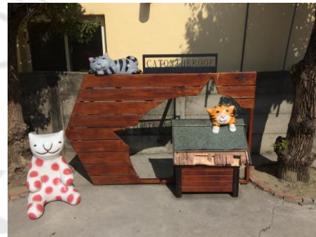
圖 2.10 貓公園裝置藝術