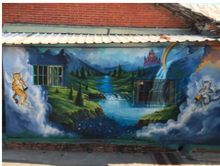
圖 2.11 上天堂的小咪