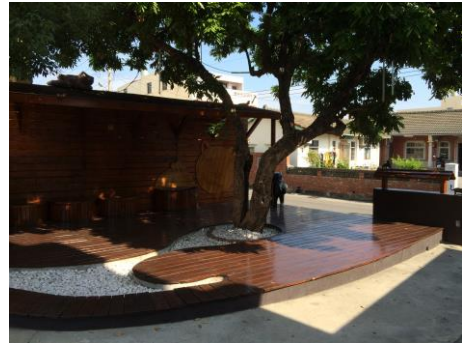
圖 2.2 貓公園