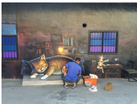
圖 2.5 修補貓公園 3D 彩繪