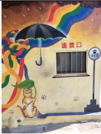
圖 2.7 貓咪車站