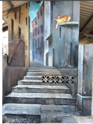
圖 2.8 回家的路