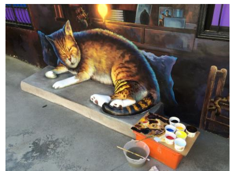
圖 2.6 貓公園 3D 彩繪修復後