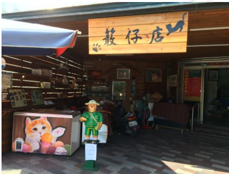
圖 2.9 招財貓