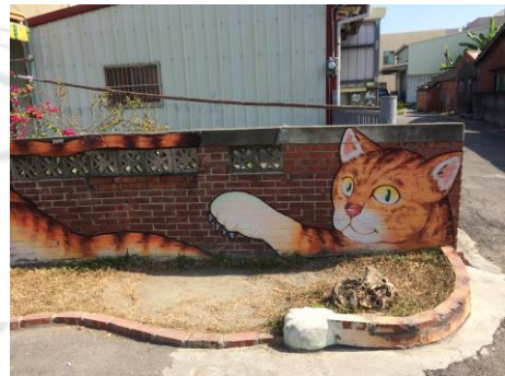
圖 2.4 聚寶盆