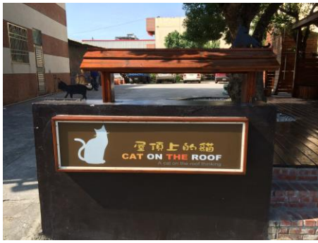
圖 2.1 貓公園招牌