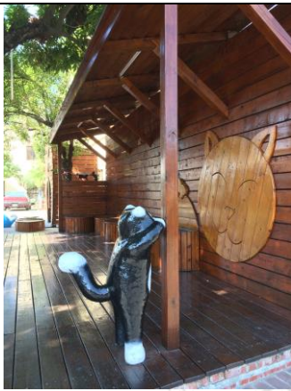
圖 2.3 貓公園裝置藝術