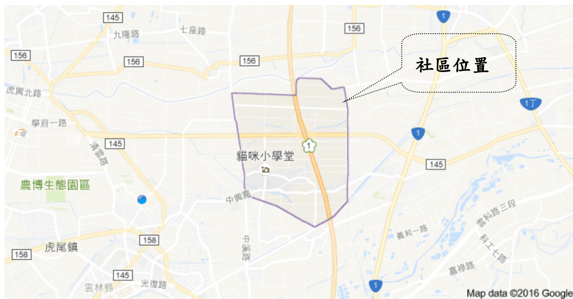
圖 1.2 頂溪社區地理位置

民生活環境所產生的影響，並希望本研究能提供雲林縣政府對頂溪社區彩繪提供旅遊發展的相關資訊與規畫，進而讓雲林縣更加繁榮。