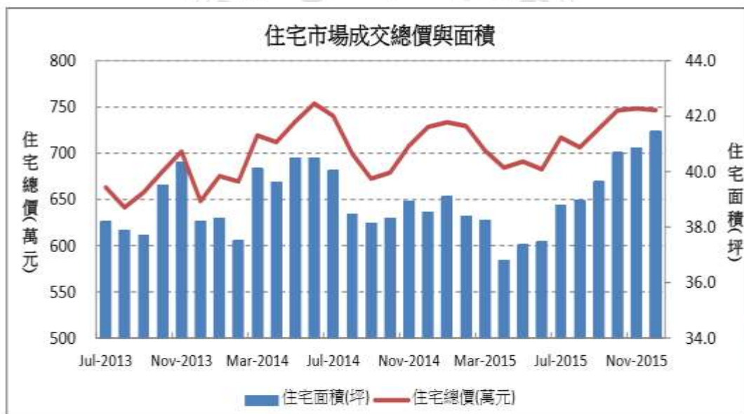
圖 1-2 高雄市 2015 年第四季住宅市場分析圖

註 1：總價統計樣本包括公寓、華廈、大樓、套房、透天厝及別墅，並排除預售物件