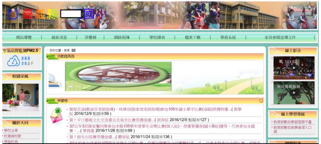
圖 4-1 D 國小網站首頁