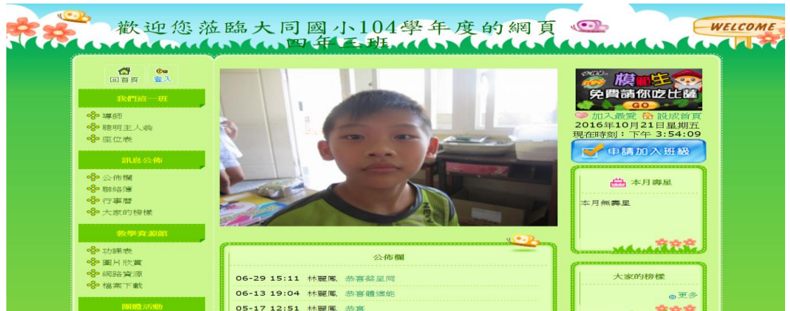
圖 4-4 班級網站之首頁

出納及科任教師也利用優學網所提供的網站設置相關的部落格。因為導師每隔兩年換新班級與老師，班級網頁每隔兩年需重新設置新的班級網頁。以下為優學網系統平台網站：