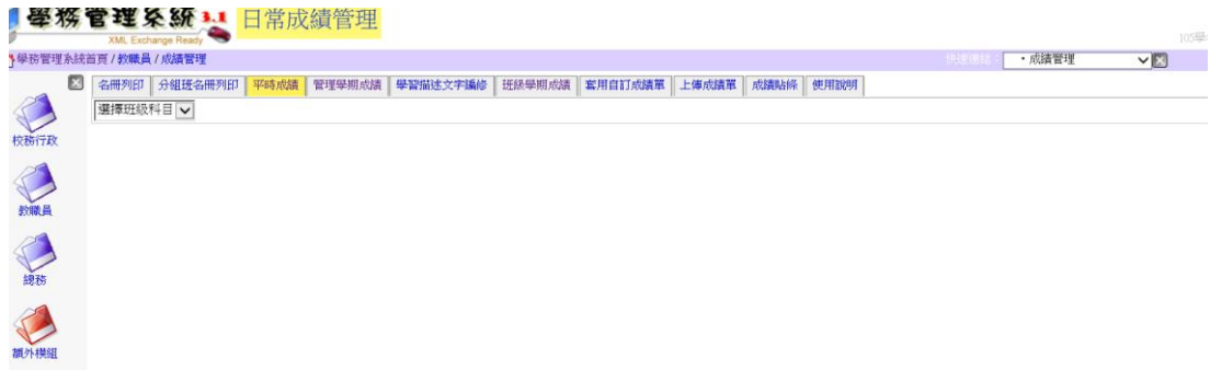
圖 4-3 學務管理系統