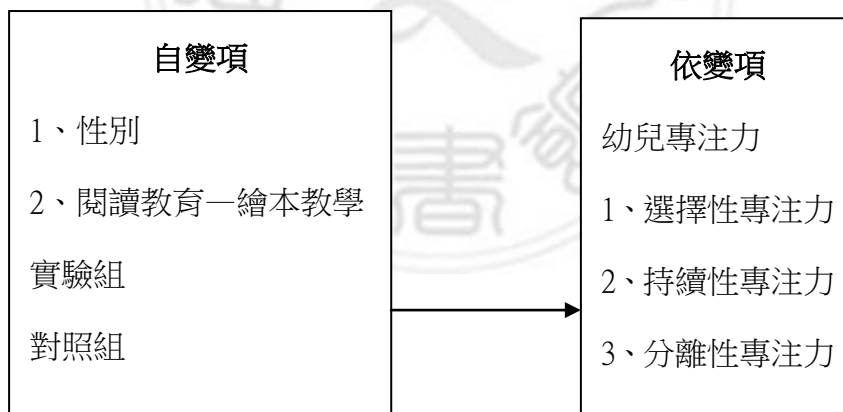
圖 3-1 研究架構圖

根據研究動機、研究目的與相關文獻理論之探討，發展出本研究架構(如圖 3-1)，旨在說明本研究所欲探討的變項，透過研究變項的調查與分析，藉以瞭解各變項間的差異情形。