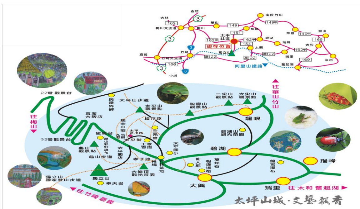
圖 1.4 梅山鄉太平社區發展協會位置圖

社區及亮點社區；2009-2013 年連任阿里山國家風景管理處之阿里山國家風景管理處清潔美化第一名；2012、2013 年入選環保署全國低碳示範社區；2012 年獲得環保署節能減碳環保行動標章；2012、2013 年入選嘉義縣社會局社會局關懷據點潛力社區；2013 年入選環保局環境教育社區績優社區...等，其地理位置如圖 1.4。