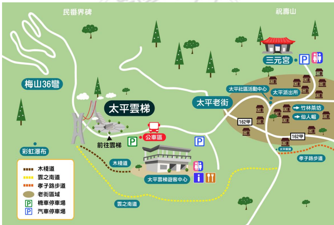
圖 1.3 梅山鄉太平社區行政區域圖

太平村位於梅山鄉的地理中心，北與圳南村相臨、東接碧湖村、南與緞繡村相鄰、西與半天村為界（如圖 1.3 梅山鄉太平社區行政區域圖所示），主要村落可分為大坪、平路、大籠山及茅仔埔。全村面積為 4.16 平方公里，人口為 545 人（截至 2018 年 09 月底之統計），密度為 131 人/Km 2 。太平社區開發可追溯至乾隆年間，先民到此開墾山林，因見到廣大平坦的山區平地，因此稱作太平，為台灣早期山區開發史的先驅。而太平山是阿里山山脈最靠近嘉南平原海拔一千餘公尺的一座山脈，由梅山平地 80 多公尺經由遠富盛名的梅山 36 彎，短短的 8 公里遽升 1000 多公尺至太平村，因為地處亞熱帶且高度由低驟升，沿途道路生態景觀及天文氣象可說是景色變幻無窮、風光明媚。