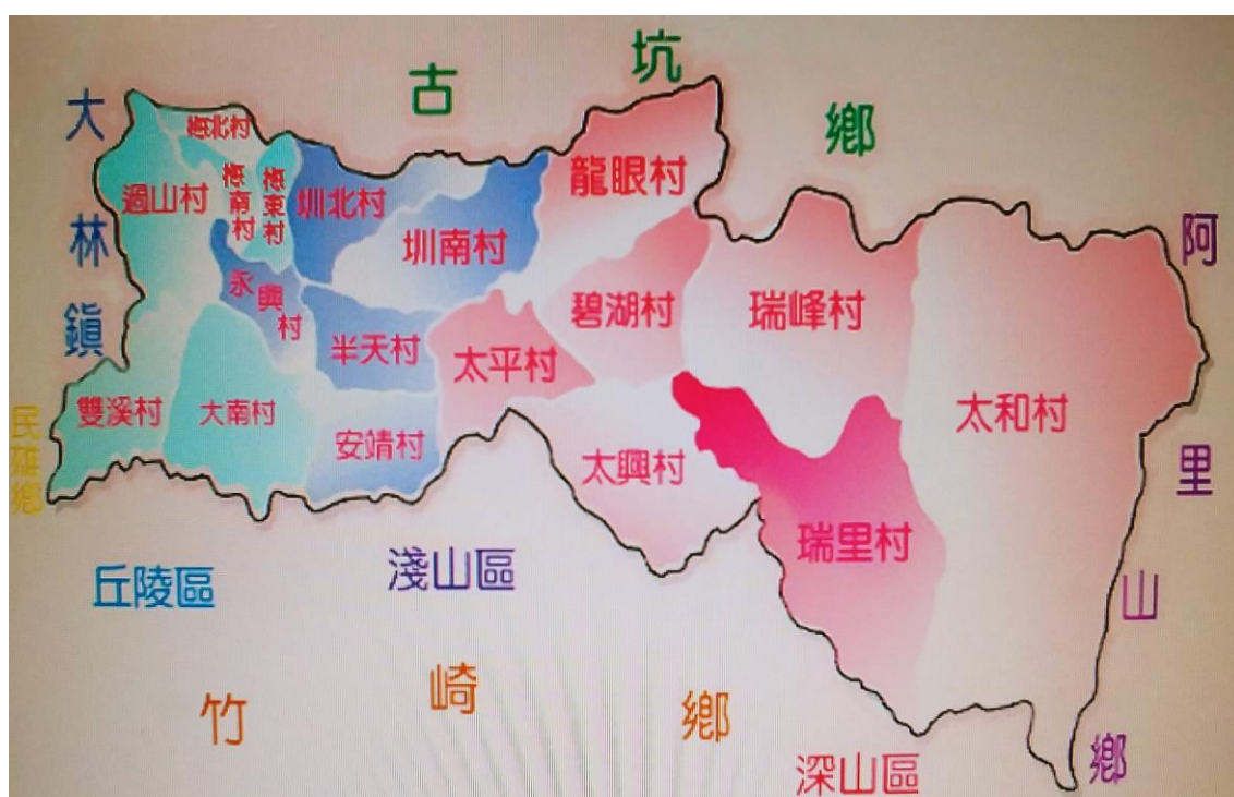
圖 1.2 梅山鄉行政區域圖

本研究範圍僅就嘉義縣梅山鄉，東鄰阿里山鄉，西鄰大林鎮、民雄鄉，北隔清水溪與雲林縣古坑鄉為鄰，南與竹崎鄉為鄰。本鄉形狀為東西向細長橫置之圖形，東西向最長直線距離約為10公里。梅山鄉行政區域圖如圖1.2所示。