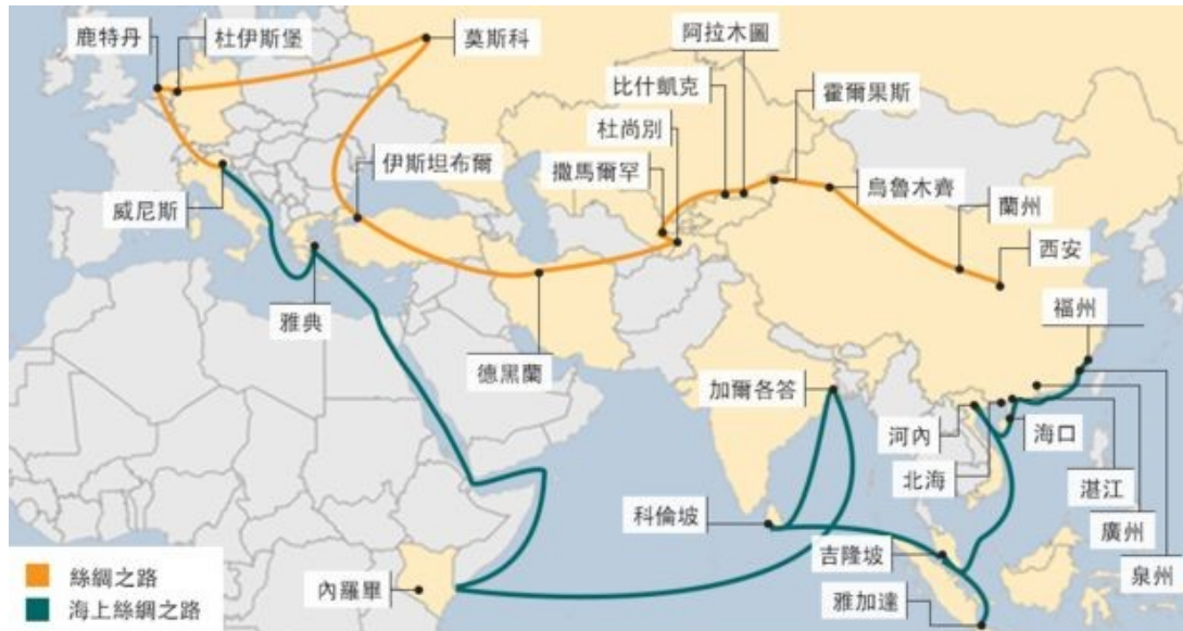
圖片 1：「一帶一路」路線圖