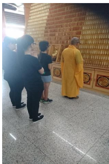
圖 4-1-4.少子化神主牌位暫奉於塔位

沒有時間去供奉這個神主牌位，可能就請去寄塔位或寺廟請人家祭拜處理，有些是寄放塔位或寺廟一年後(如圖 4-1-4)，再回家和祖先合爐或是在塔位、寺廟安奉買永久的牌位(如圖 4-1-5)，有些家屬把他們家的祖先牌位請往寶塔去，有部分原因是少子化，更多原因是家庭成員分居各地，各自忙碌、無暇祭拜，甚至無心祭拜了，而移往寶塔或寺廟請人祭拜，所以葬後祭祀階段的返主、安靈和朔望奠，這三個儀式是有影響的。由於傳統的喪禮能兼顧理智與感情，讓死者之子孫節哀而順變，因而沿襲了數千年，然而當前是一個現代化工商社會，它和傳統的農業社會有許多差異，昔日傳統的喪葬儀節規範，不一定完全適合當前國人的需要。