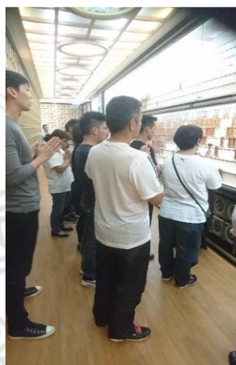
4-1-5.少子化神主牌位永久供奉於塔位