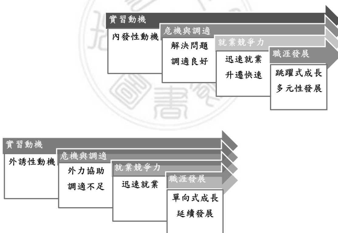
圖 5.1 研究理論意涵圖

經綜合本研究所探討之研究問題，依據研究目的、受訪者所提供的經驗與意見，設計研究理論意涵如圖 5.1 所示：