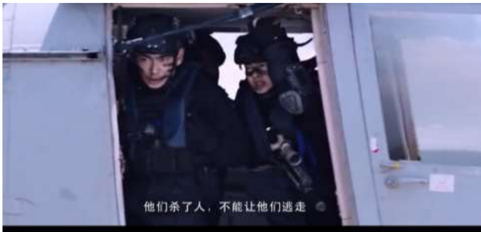
圖 5.14 遏止海盜任意妄為