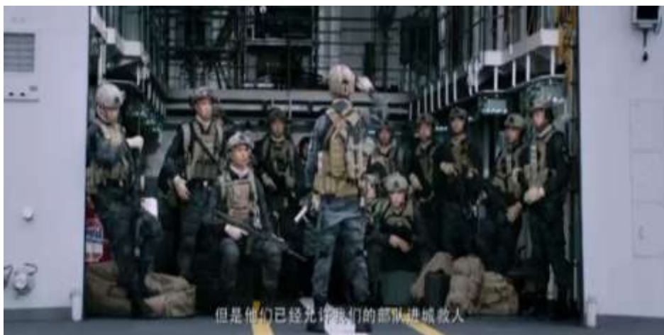
圖 5.58 伊維亞共和國允許中國海軍前往撤僑