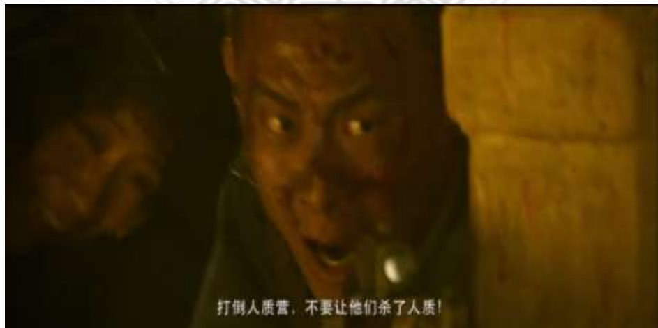
圖 5.30 搶救他國人質