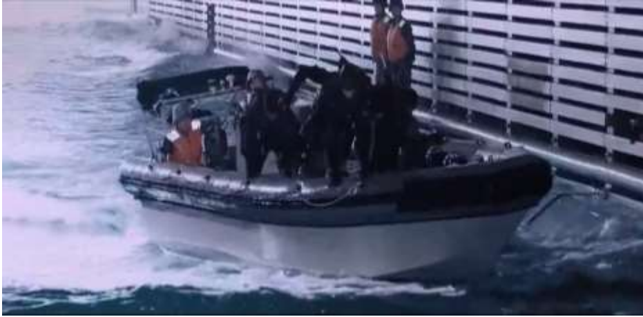
圖 5.8 726 型氣墊登陸艇