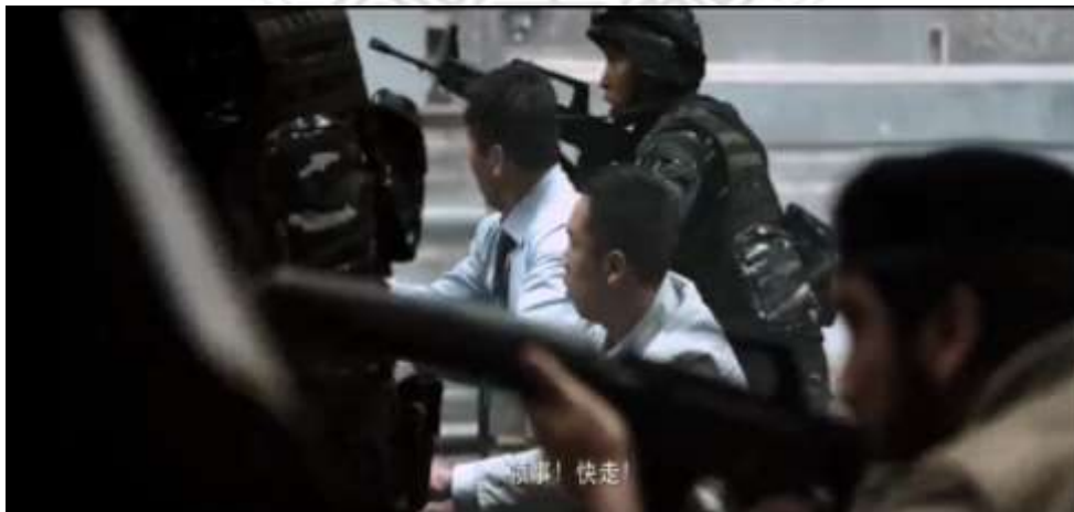
圖 5.18 中國軍人協助中國人民進入建築物避難