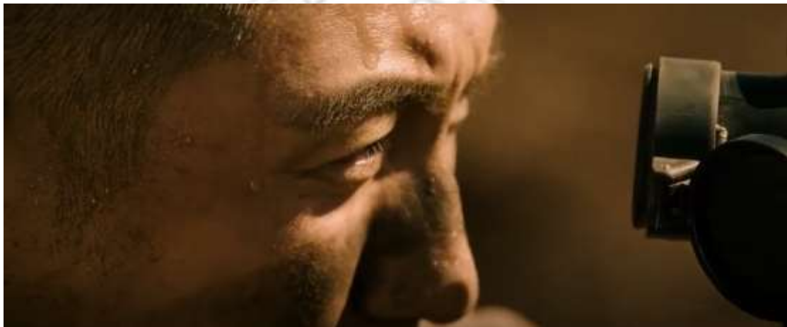
圖 4.6 頂上特寫

https://www.movieffm.net/movies/operation-red-sea/