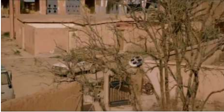
圖 5.11 無人機炸彈(手擲)