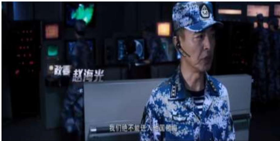
圖 5.55 中國海軍強調不可進入他國領海

在電影一開始，中國商船遭受海盜攻擊，中國海軍前往搶救，在拯救的過程中，中國海軍再三強調不可闖入他國的領海（圖 5.55），即便是追緝海盜（圖 5.56），看似合法的行為，中國海軍仍禁止國人進入他國領域（圖 5.57）。其中電影中有一幕，伊維亞共和國已發生戰亂，中國僑民已受到危急，直到他國允許中國前往他國領土救援（圖 5.58），他們才盡速整裝前往，由此可以得知，中國不會為了祖國的人民已受到危害或打擊國際敵人等等因素，而任意妄為的侵入他國領域，他們仍重視國際公約，遵循聯合國憲章。