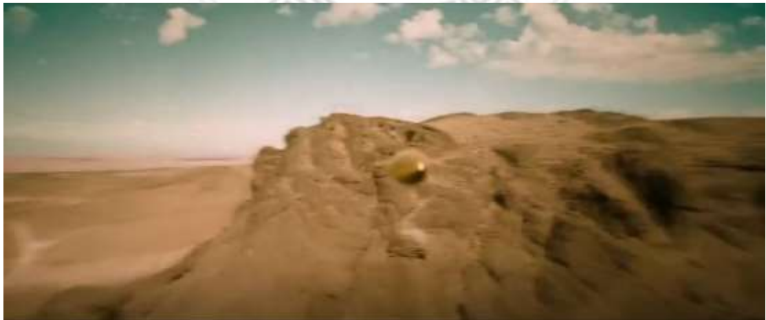
圖 4.22 跟鏡頭-1

攝影機追隨主體移動方式拍攝，因拍攝時攝影機及主體均同時運動，給人感覺主體是不動的，畫面中的景物不斷地變換效果，亦能了解主體運動的方向，如圖4.22到圖4.24，子彈為主體，影片中的景物不斷更動，能明顯看出子彈的運動方向。