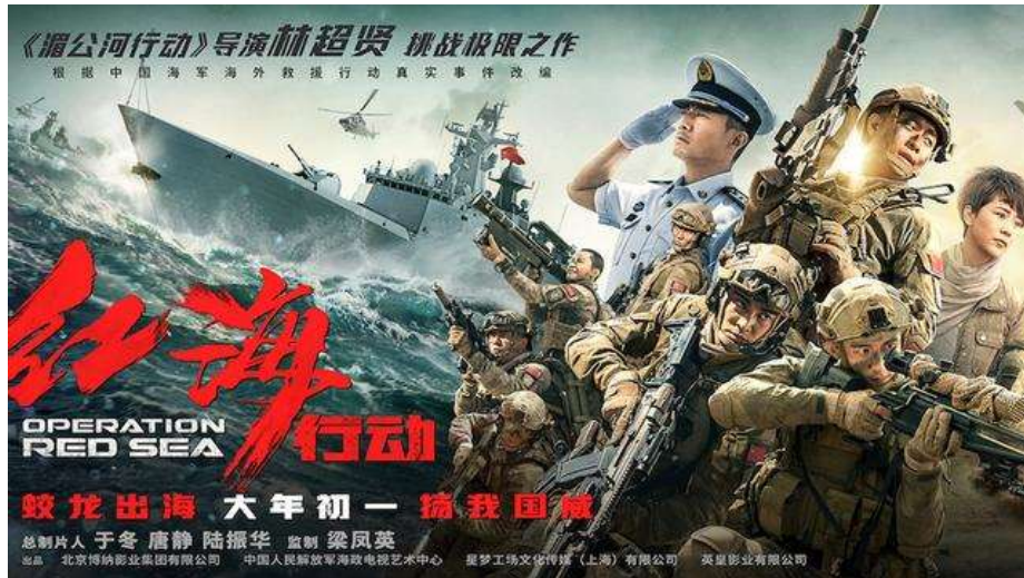
圖 6.1 《紅海行動》海報