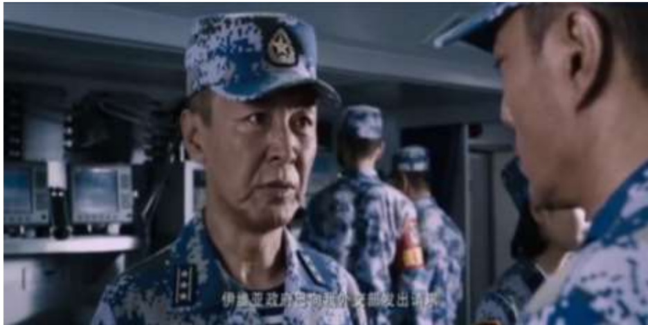
圖 5.59 伊維亞共和國請求中國協助幫忙

然而在電影最後約 15 分鐘，絞龍突擊隊知道恐怖組織要搶奪黃餅（炸藥的原料），伊維亞和共和國政府不願處理(圖 5.60)，他們認為攸關世界的危機，不可置至不理(圖 5.61)，在尚未得到上級命令，自行前往拯救，其中能看出中國為了維護國際上的安全，足以對抗恐怖組織，甚至能壓制他們，表現出中國肩負大國的形象崛起。