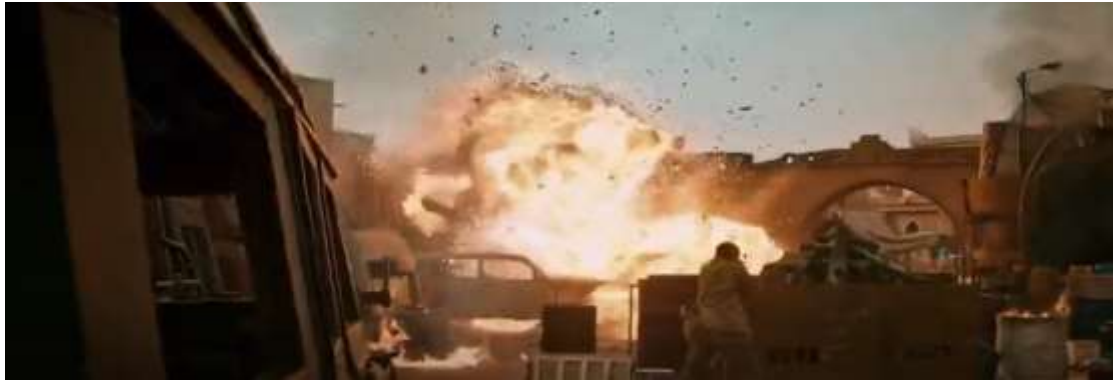
圖 4.12 升降鏡頭-3