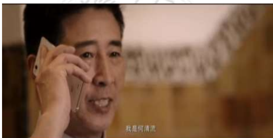
圖 5.51 中國駐外領事聯絡尚未抵達中國駐外大使館之中國人員