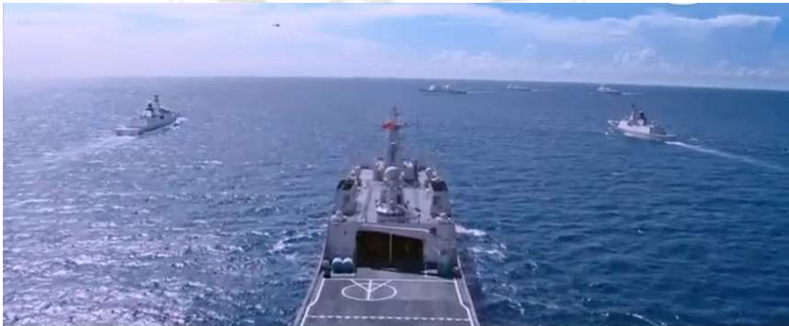
圖 4.1 極遠景畫面

從遠距離描述廣大面積，要使閱聽人了解其中背景或印象，透過它的宏偉動容閱聽人，時常被運用在描述設定背景的地理關係，通常電影的開始或是介紹都會使用此種手法，例如：將攝影機架設於飛機上，拍攝整個地域，如圖4.1，中國海軍在海洋上驅趕海盜，畫面中鏡頭架設於高空中，向前及下方拍攝整個海域，其中天空中的飛機及海上的船隻，於整個畫面中由近至遠，物體越來越小。