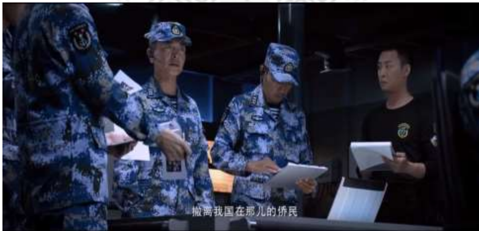
圖 5.15 中國海軍派遣蛟龍突擊隊前往撤僑