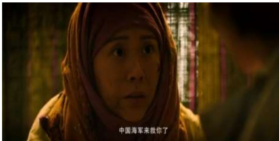
圖 5.53 海龍突擊隊進入人質營搶拯救中國僑民