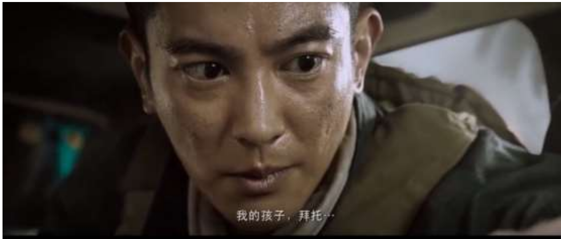
圖 4.5 頭的特寫

資料來源：《紅海行動》，Movieffm電影線上看，2020年5月23日線上擷取，