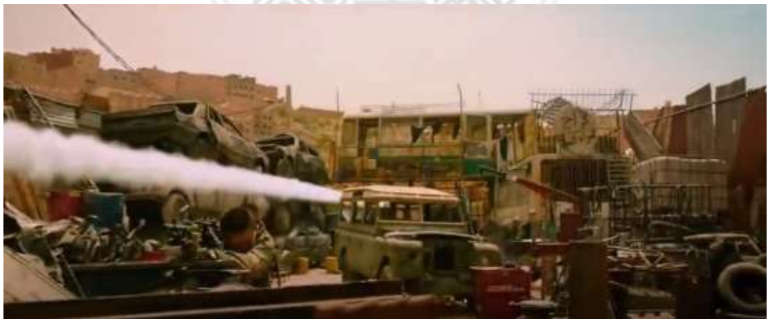
圖 4.20 移鏡頭-3