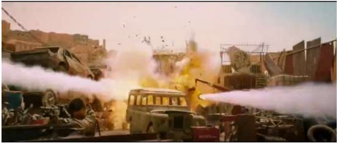
圖 4.21 移鏡頭-4