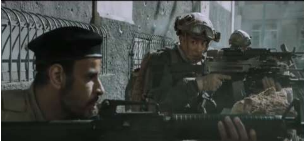
圖 5.19 蛟龍突擊隊與非洲軍隊一同合作