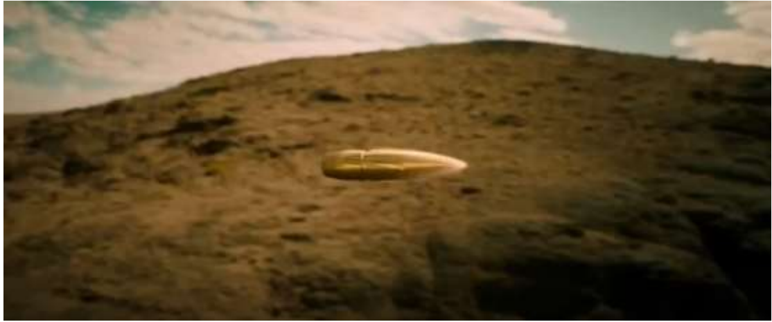
圖 4.23 跟鏡頭-2