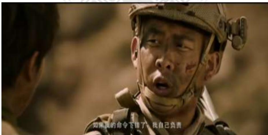
圖 5.48 隊長為自己所作所為負責