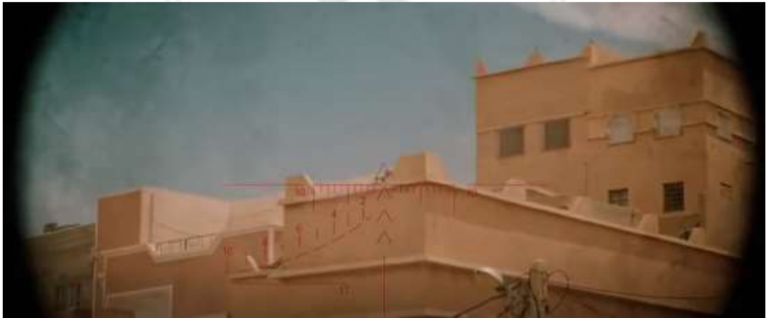
圖 4.9 低角度

攝影機對主體仰攝鏡頭，將攝影機設置在攝影師眼睛以下拍攝，如圖 4.9，敵人發現蛟龍突擊隊人員，攝影機透過武器上的瞄準具，由低處往上攝影。