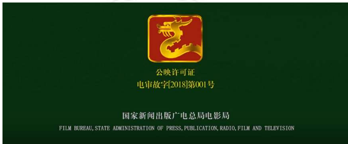
圖 2.3 《紅海行動》公映許可證

審查機構接收製作單位送審之電影應於30日內，以書面方式通知送審單位。審查電影若合格，國務院廣播電影電視行政部門核發製作單位《電影片公映許可證》，始可播放電影 62 。