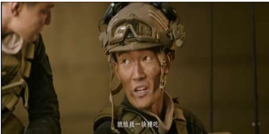
圖 5.22 隊員利用吃糖果來消彌害怕