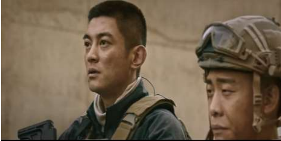
圖 5.21 副隊長訴說救援時，對方請他協助拯救他的孩子。