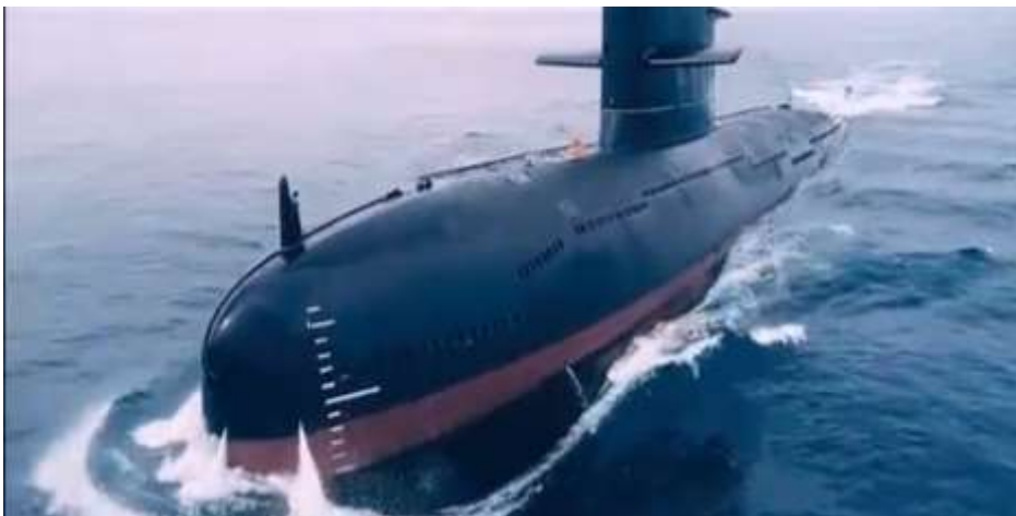
圖 5.9 39 型潛艇