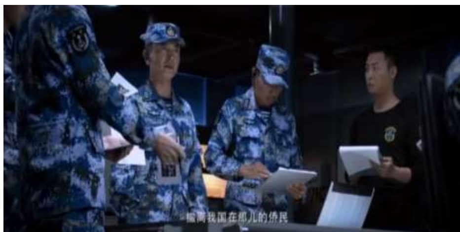
圖 5.50 伊維亞共和國發生政變，中國政府派人前往拯救國人。

正如電影中所言：「一個中國人都不能傷害」(圖 5.54) 105 ，由此可見，中國政府對於在外的僑民給予最強大的保護，中國政府在外交工作內容上，保護僑民已成為重要的一環。