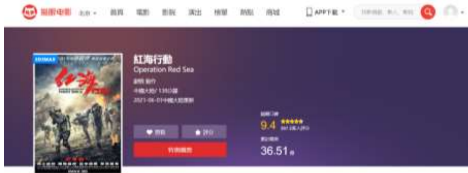
圖 6.3 貓眼電影《紅海行動》票房及評分