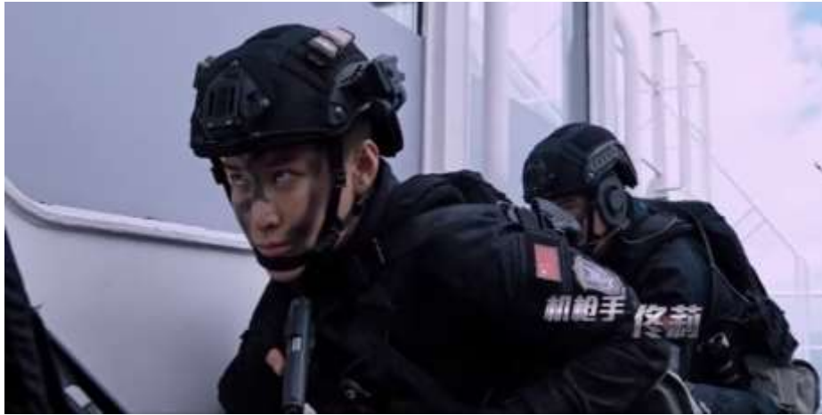
圖 5.2 92 式手槍