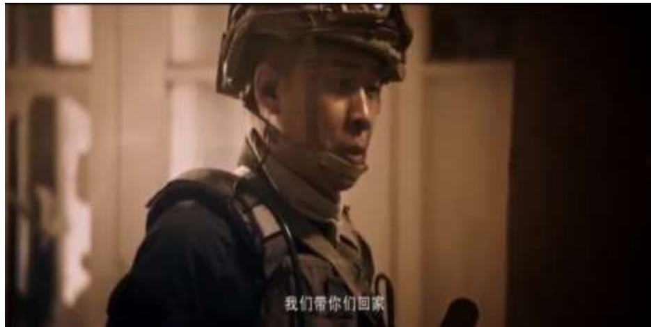
圖 5.52 海龍突擊隊進入災區搶拯救中國僑民