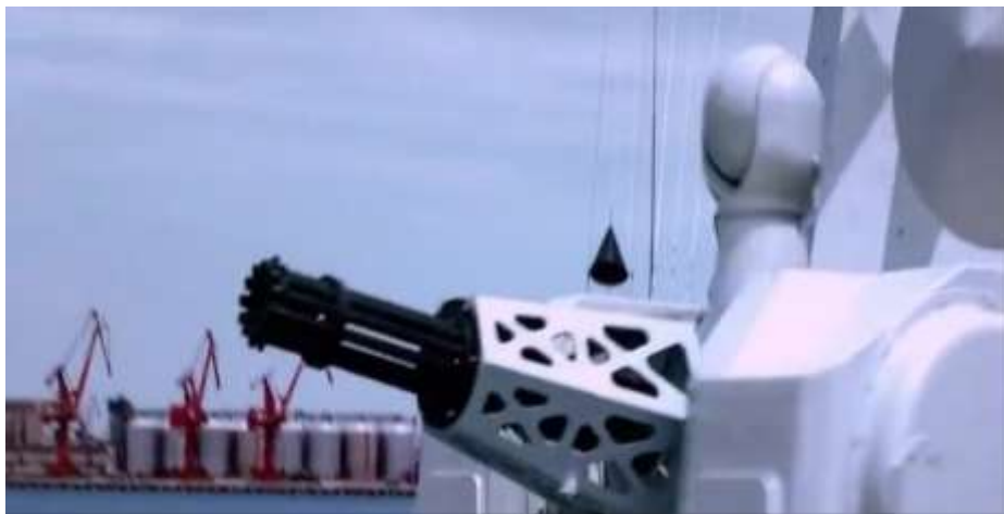
圖 5.6 1130 型近程防空炮