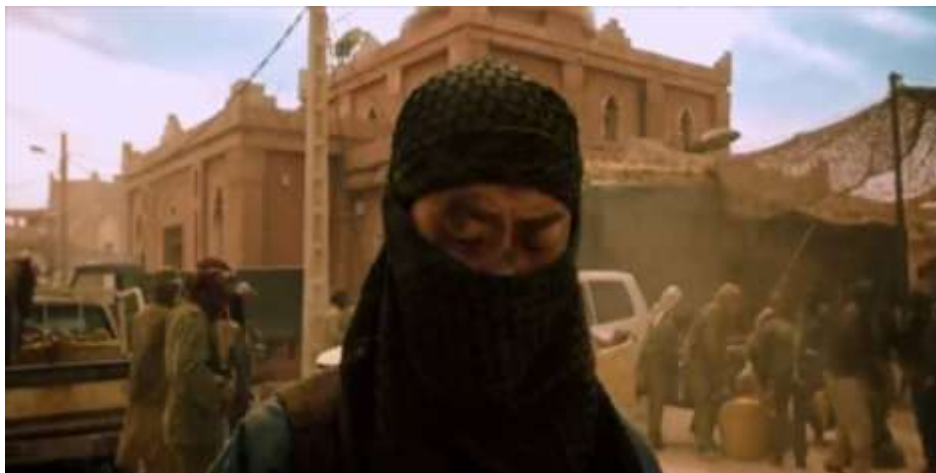
圖 5.26 隊員偽裝成恐怖組織成員