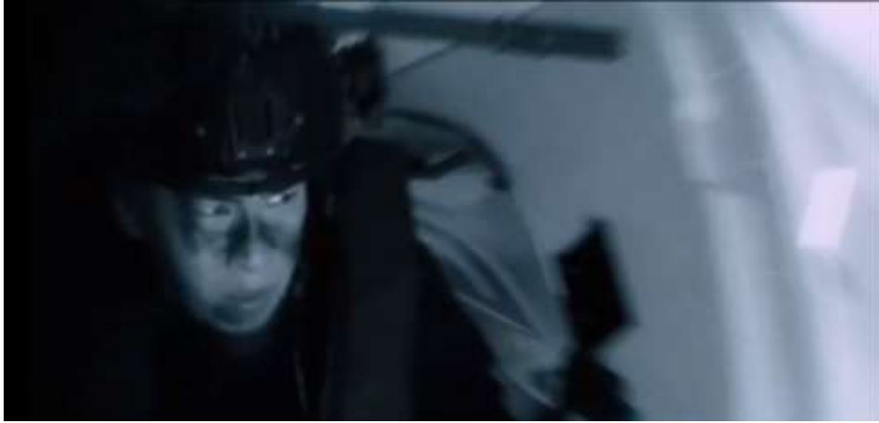
圖 5.24 對於戰場上子彈四處飛而感到害怕