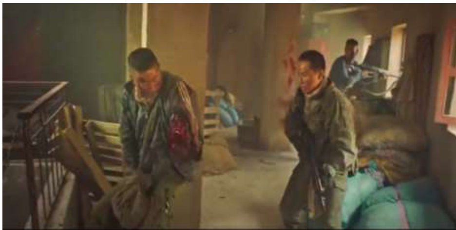
圖 5.47 絞龍突擊隊員遭炸傷