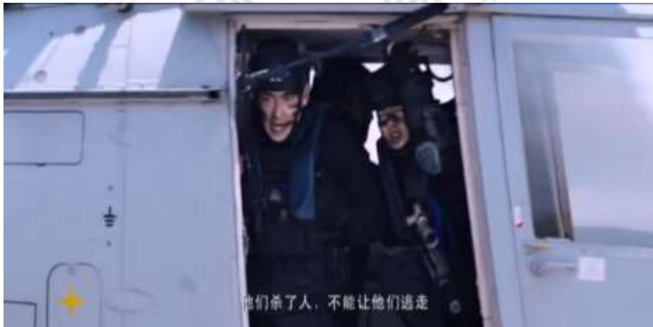
圖 5.56 隊員不放過海盜