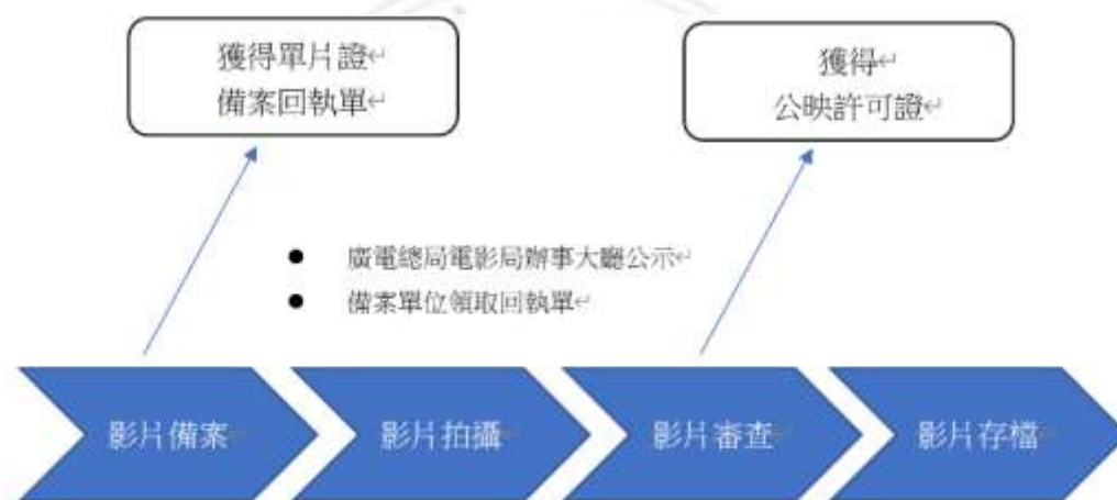
圖 2.1 中國電影拍攝流程圖

中國電影走向商業化，為了吸引更多的閱聽人，加入各式各樣特別元素，在共產體制下，電影產製許多受限，例如：主題不可偏離國情、血腥畫面無法特寫拍攝及涉獵軍警相關議題，需接受核准等等因素。究竟一部電影在中國上映需要接受多少審查，始可放映？中國國家電影管理局分別於1997年1月16日頒布《電影審查規定》、2002年2月1日頒布《電影管理條例》、2004年8月10日頒布《電影劇本（梗概）立項、電影片審查暫行規定》及2006年4月3日頒布《電影劇本（梗概）備案、電影片管理規定》等規定來審查中國電影 57 ，而一部完整電影攝製過程可區分為三個階段：電影劇本備案、電影拍攝及電影審查，如圖2.1。