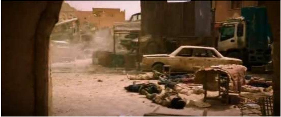
圖 4.18 移鏡頭-1