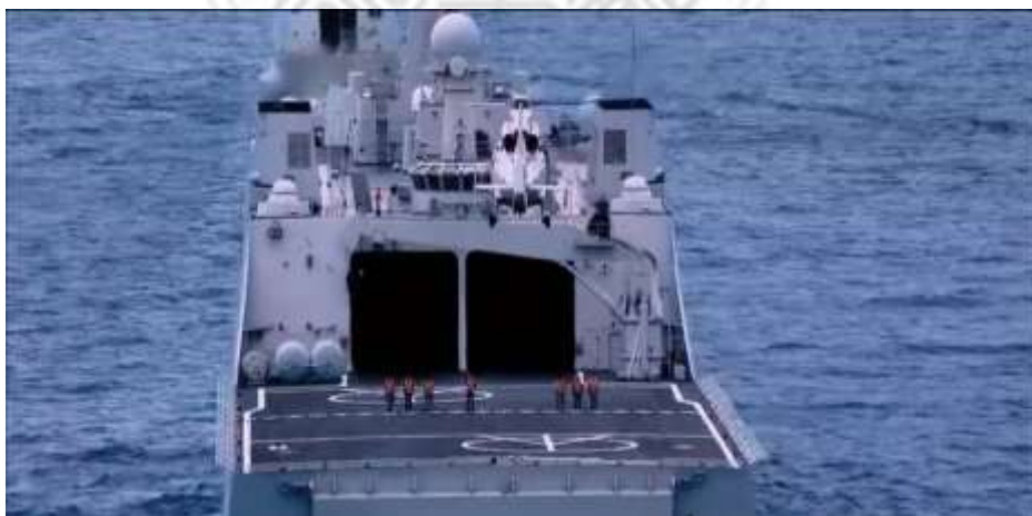
圖 5.7 071 型綜合登陸艦