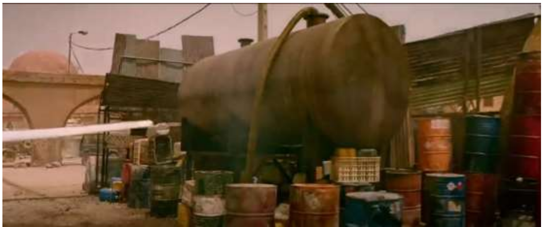
圖 4.19 移鏡頭-2