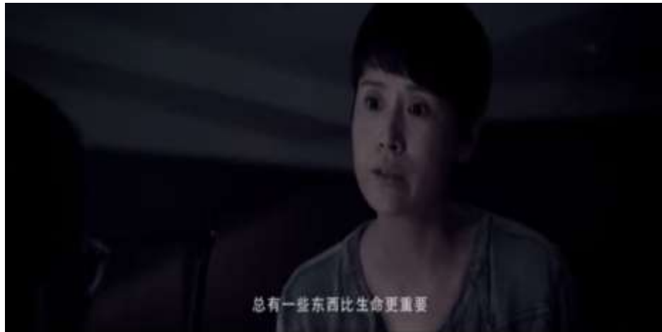
圖 5.32 戰地記者的認知

國人民，立即通知中國給予協助（圖 5.37），並偕同中國蛟龍突擊隊前往拯救人質，拯救過程中自願頂替為人質（圖 5.38），曾未接受任何軍事訓練的她，仍拾起槍枝射殺恐怖組織（圖 5.39），這種種的表現，能看出身為中國戰地記者不僅肩負著愛國主義亦展現其強大的隨機應變能力，只為了保護祖國。