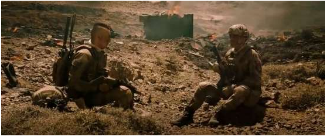
圖 4.3 中景