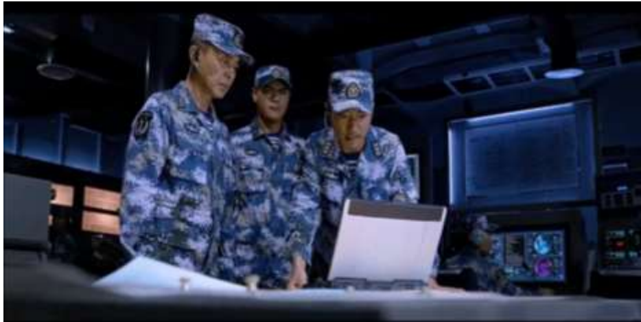
圖 5.43 艦長看到恐怖組織發的視頻，氣到罵粗話。