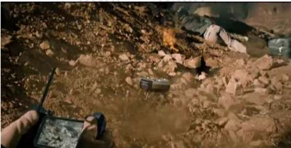
圖 5.10 無人機炸彈(遙控操作)