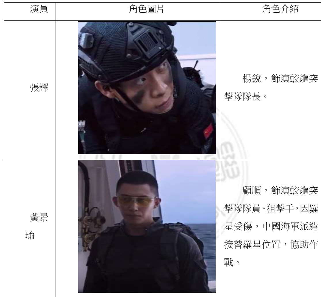
表 4-3 《紅海行動》演員 VS.角色介紹

本片根據 2015 年葉門內戰撤僑行動的真實事件改編，先以索馬里海域外，中國商船遭遇劫持，船員全數淪為階下囚，蛟龍突擊隊沉著應對，潛入商船進行突襲，成功解救全部人質。演員扮演角色介紹：