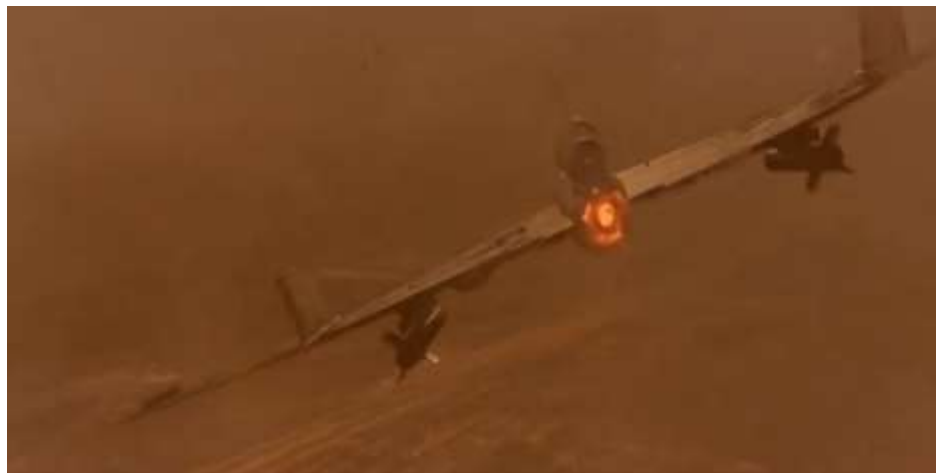
圖 5.12 無人機