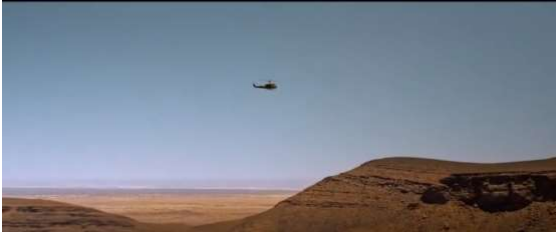
圖 4.14 推鏡頭-2