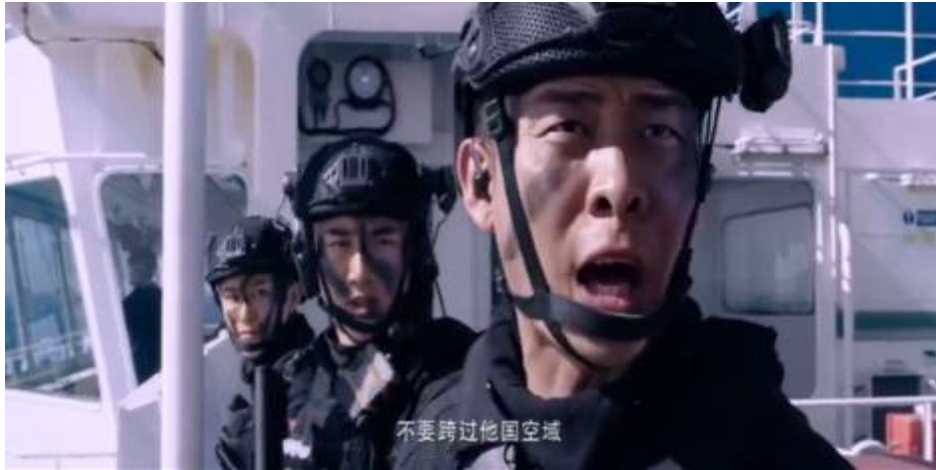
圖 5.57 隊長要求隊員不可進入他國領域