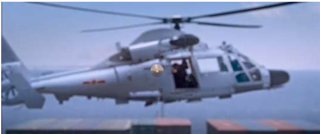
圖 4.7 水平角度

指從平均高度的旁觀者眼睛水平或從主體眼睛水平拍攝，通常拍攝時機用於水平景象、保持縱線原形和兩個平行關係，此種拍攝手法能保持真實性。有時為了創造戲劇效果會使用水平角度攝影，例如：汽車、火車或是飛機等連續動作物體朝向攝影機方向快速前進，給閱聽人一種震撼效果，如圖4.7，狙擊手開槍射殺海盜，畫面中對焦於由槍射出來的子彈，朝著攝影機的方向迎面而來，使閱聽人感受到子彈似乎朝著自己而來，不禁有閃躲的動作。