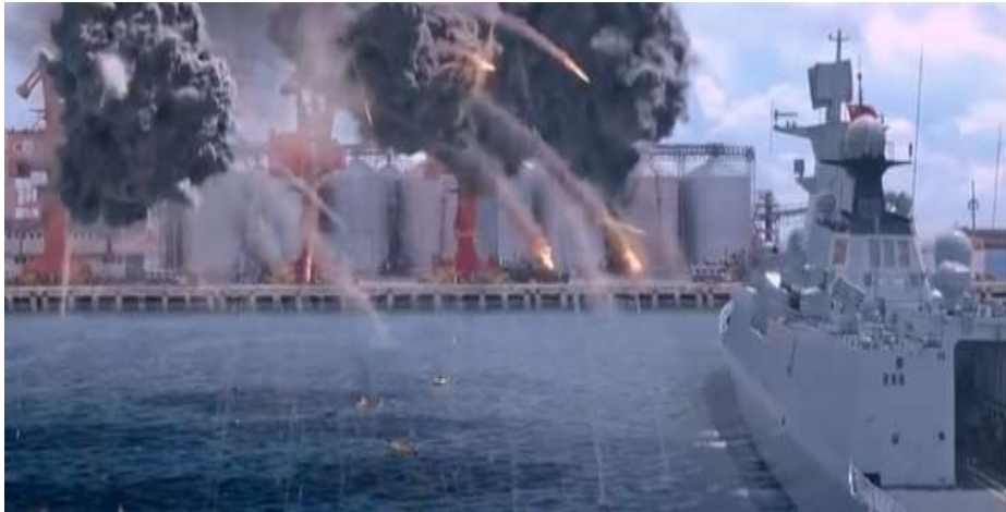
圖 5.5 遏止恐怖組織導彈的襲擊