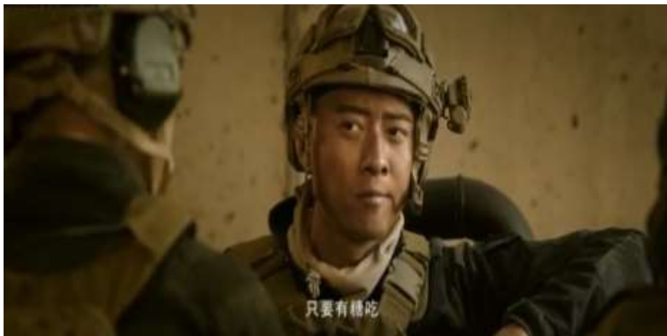
圖 5.44 石頭覺得吃糖能解決一切-1