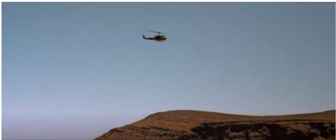
圖 4.15 推鏡頭-3