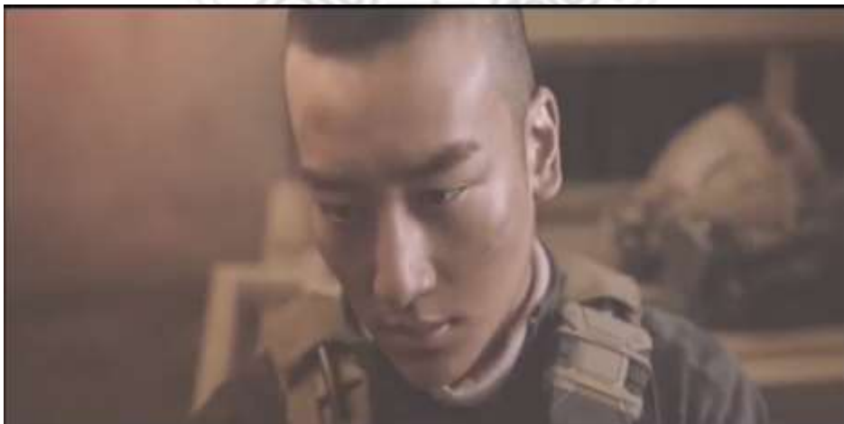
圖 5.23 戰場上的死傷，造成心理的害怕。