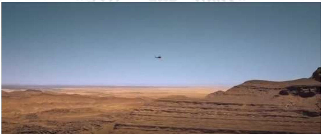
圖 4.13 推鏡頭-1

攝影機依循光軸方向前進，由遠而近或從多個到單一變化，增強畫面逼真及可信度，使閱聽人有身在其中之感覺，如圖4.13至4.15，直升機搭載著去搶救「黃餅」資料的蛟龍突擊隊人員，攝影機由遠而近的攝影。