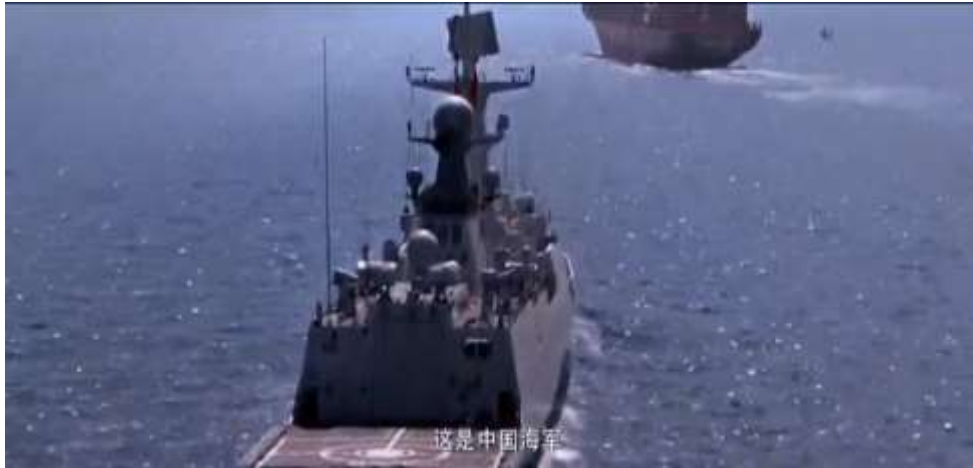
圖 5.13 中國海軍前往拯救