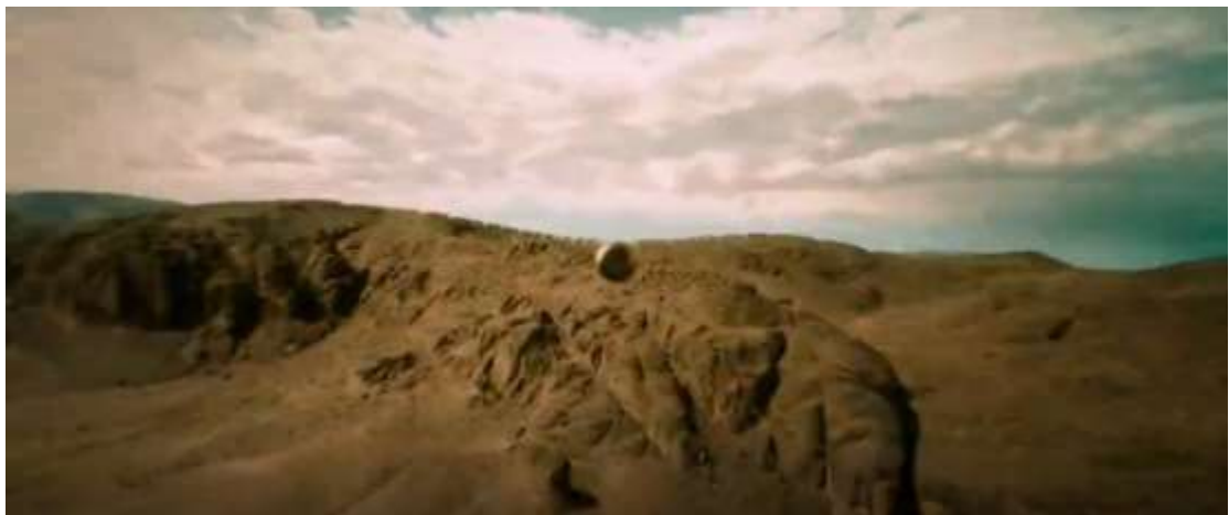
圖 4.24 跟鏡頭-3