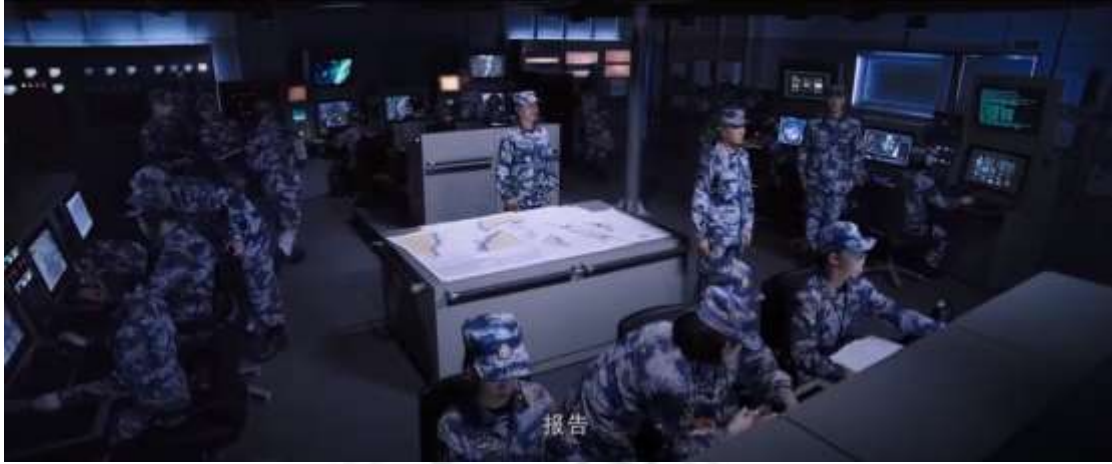
圖 4.2 遠景畫面

指動作所涉及的整個面積。場景中的人、事、物及地方都要在遠景中顯現出來，使閱聽人明白其中的意義。如圖4.2，中國海軍軍艦操作軍艦的控制室，從畫面中可以看見軍人，分別於自己負責的機台上作業。