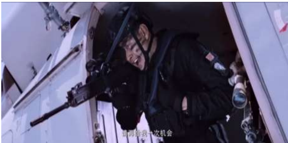
圖 53 88 式狙擊步槍