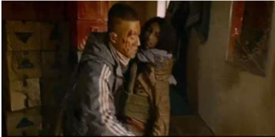
圖 5.31 他國人受傷，中國軍人協助處理。