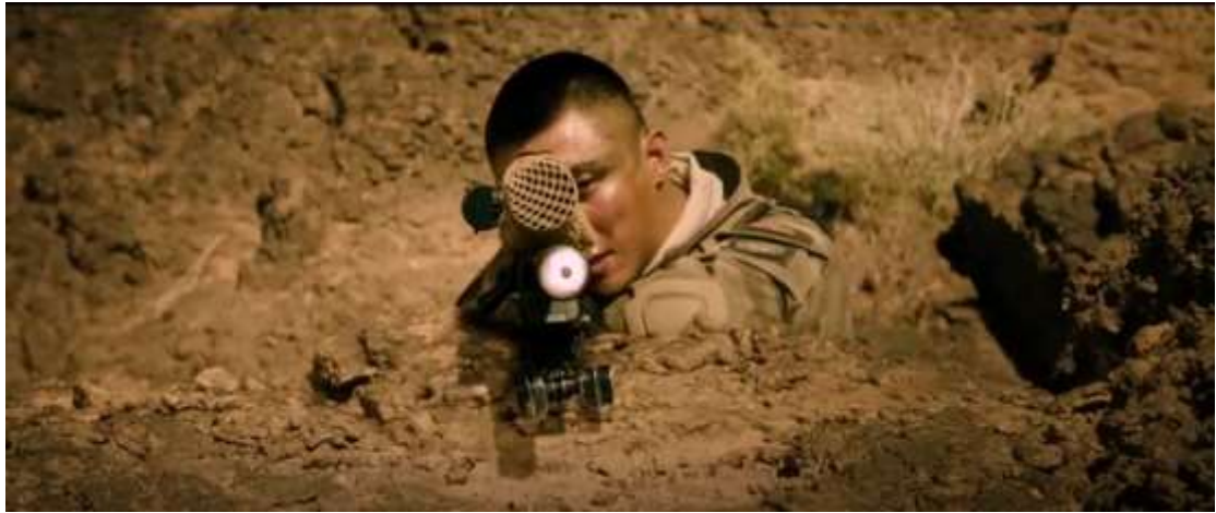
圖 4.16 拉鏡頭-1