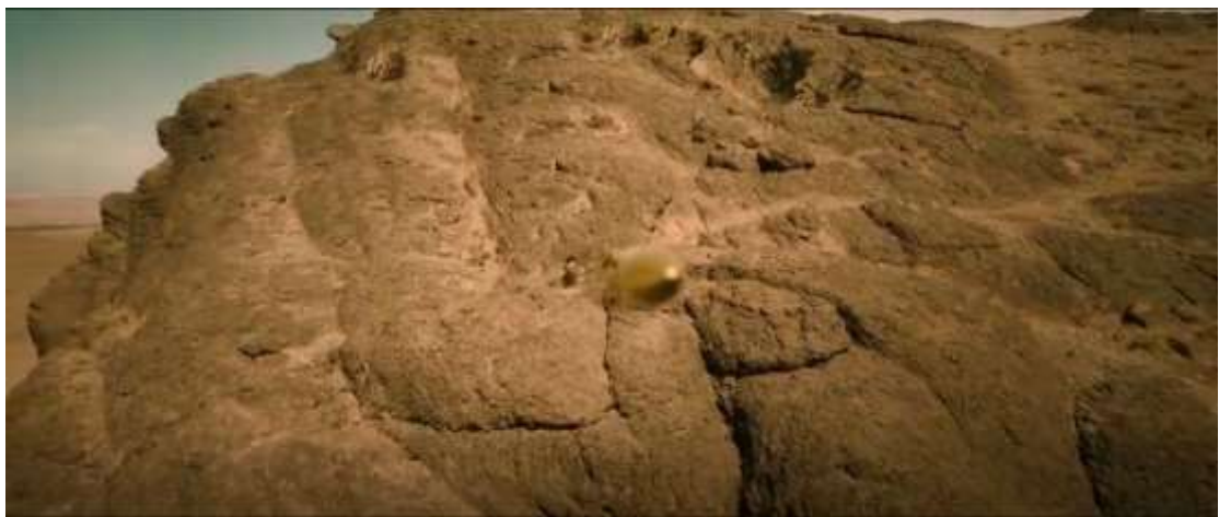
圖 4.17 拉鏡頭-2