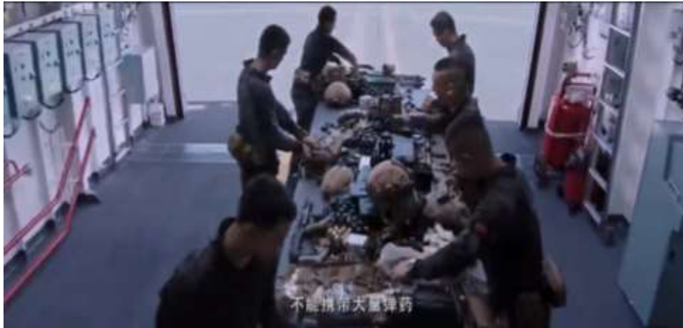
圖 5.16 無法攜帶大量彈藥