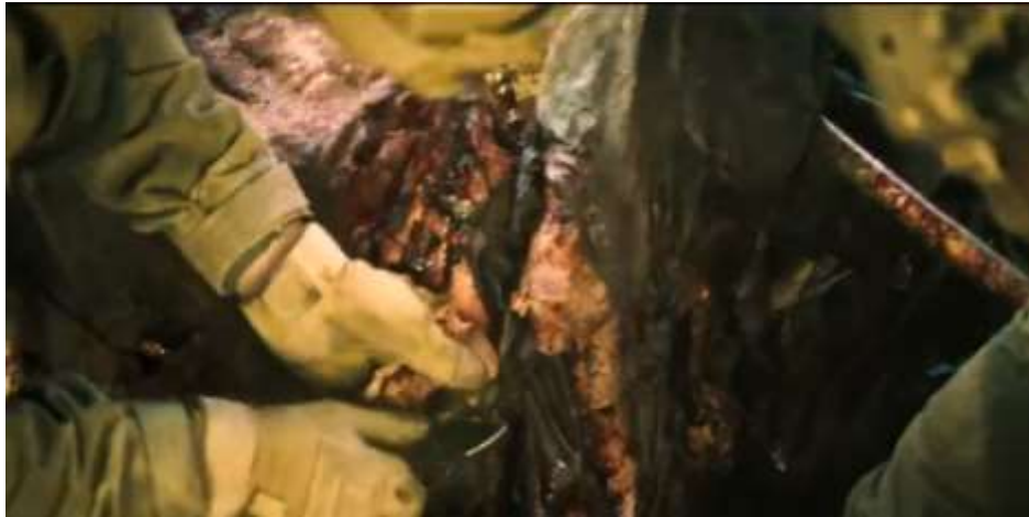
圖 5.46 逃難人員遭炸傷