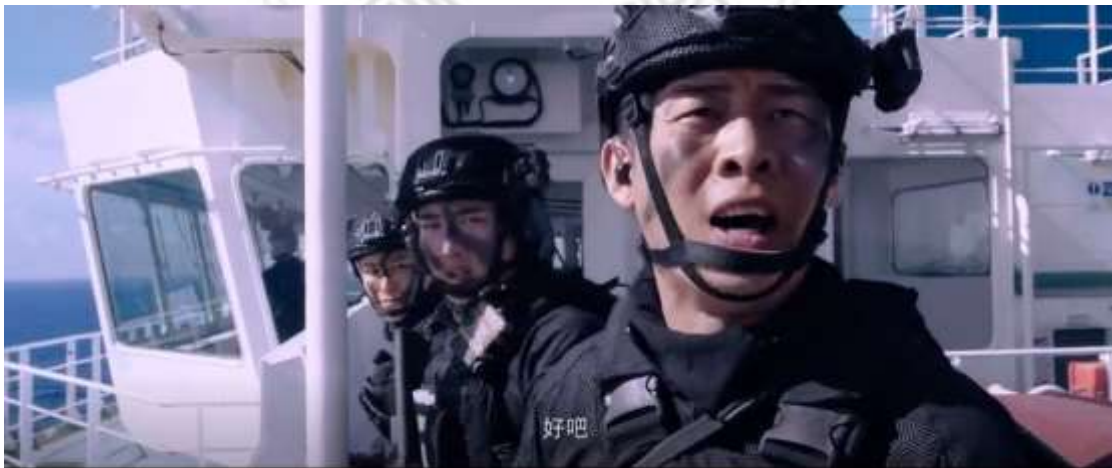
圖 4.4 頭和肩特寫

從肩至頭部為頭和肩特寫，如圖4.4，為隊長同意羅星追緝海盜；只有頭部為頭的特寫，如圖4.5，徐宏拯救汽車炸彈客的表情；從嘴唇至眼睛的面部為項上特寫，如圖4.6，顧順發現敵人所在地，透過瞄準具瞄準敵人，準備射殺敵人，全神貫注表情。