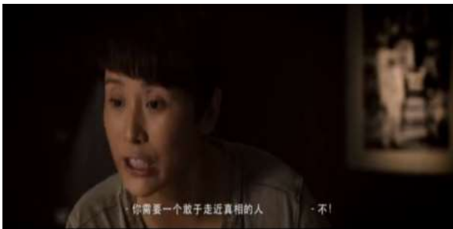
圖 5.36 夏楠堅持親自前往