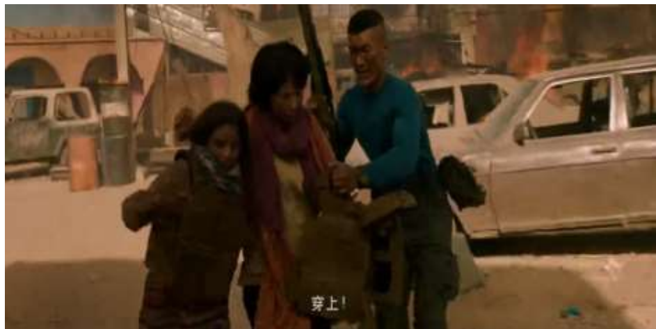
圖 5.29 隊員將自身的防彈背心給中國人質穿