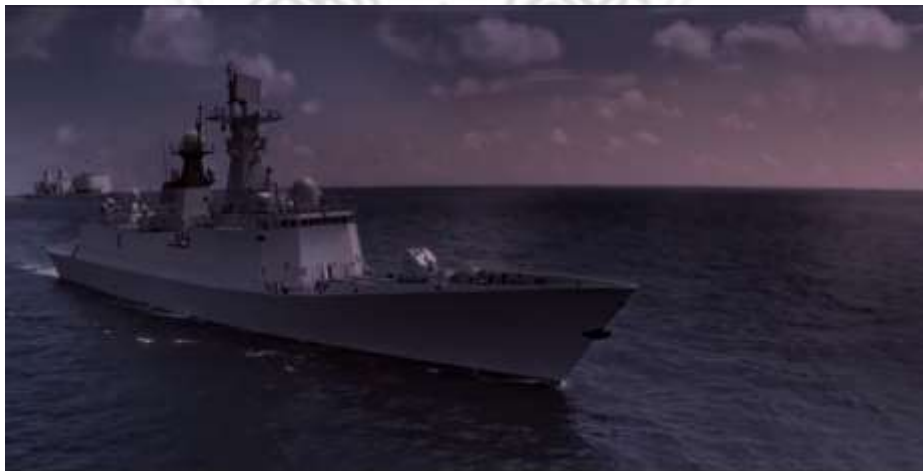
圖 5.4 054A 型飛彈護衛艦