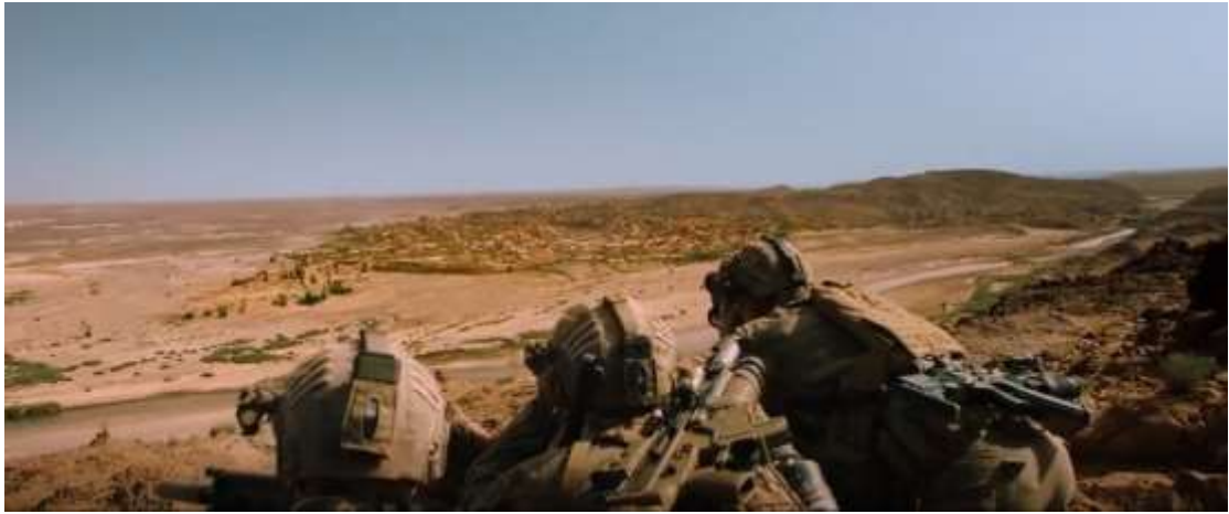
圖 4.8 高角度

資料來源：《紅海行動》，Movieffm電影線上看，2020年5月23日線上擷取，