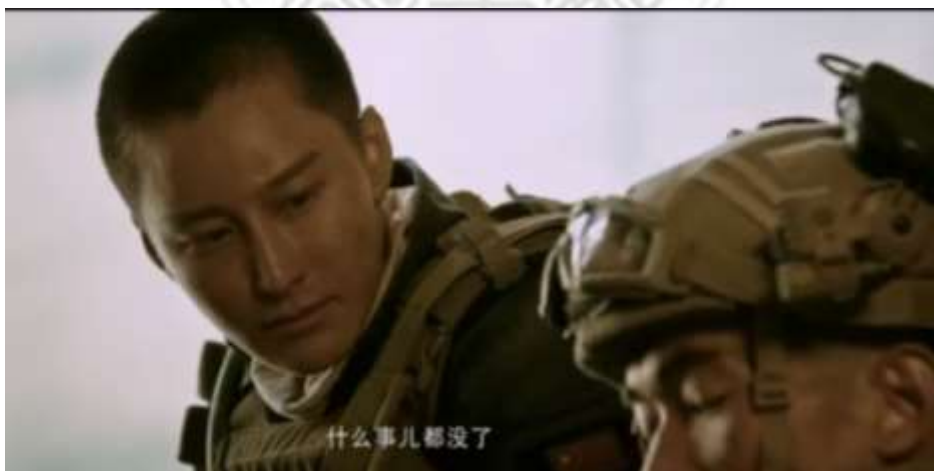
圖 5.45 石頭覺得吃糖能解決一切-2