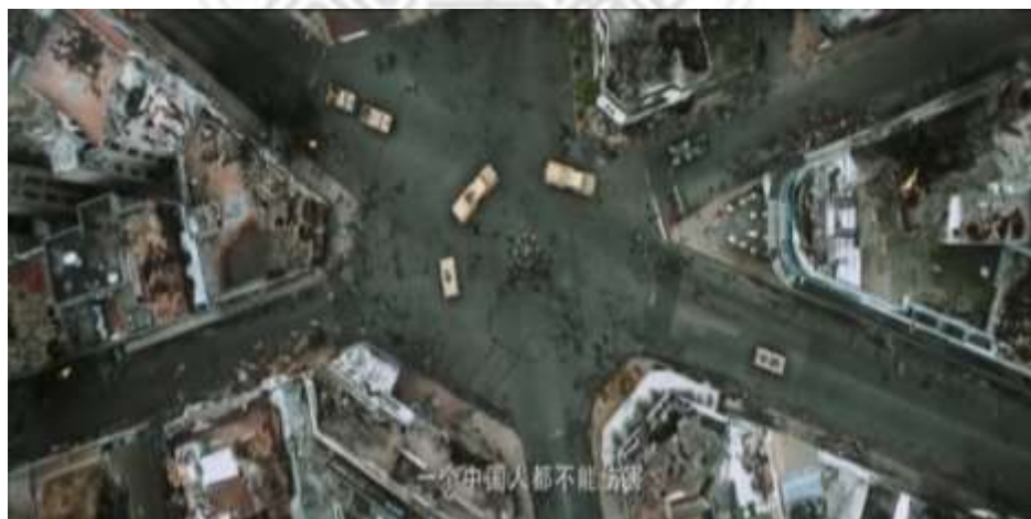
圖 5.54 中國政府積極保護註外僑民