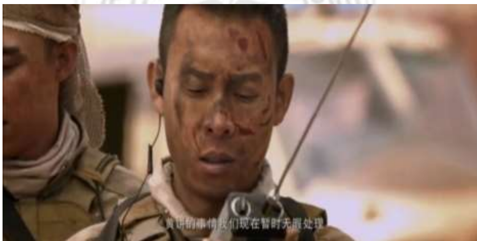
圖 5.60 伊維亞共和國無法處理黃餅事件