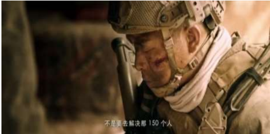
圖 5.49 隊長認為是解救人質非處決恐怖組織