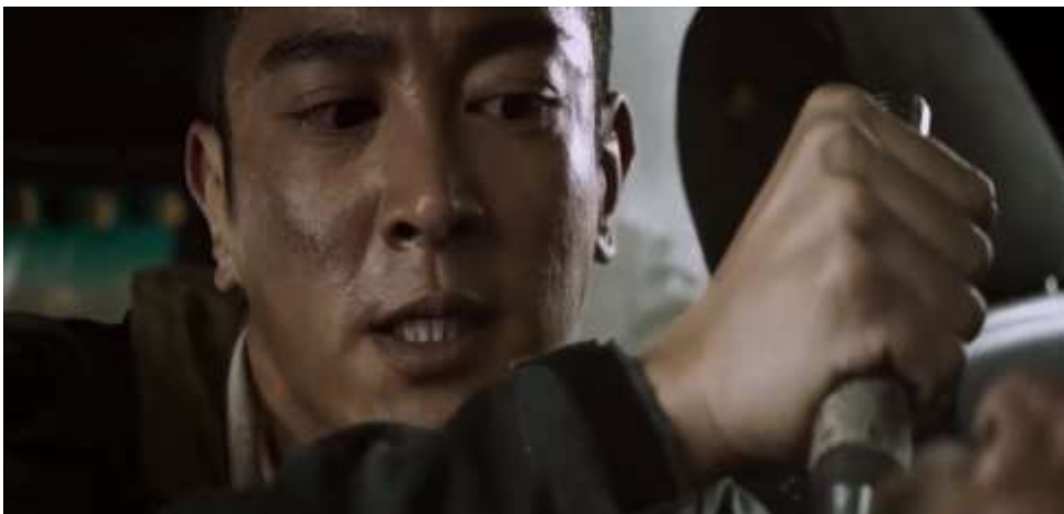
圖 5.20 蛟龍突擊隊員搶救遭恐怖組子裝上炸彈的當地民眾