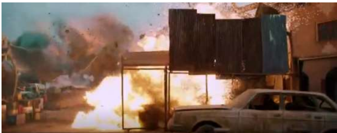
圖 4.11 升降鏡頭-2