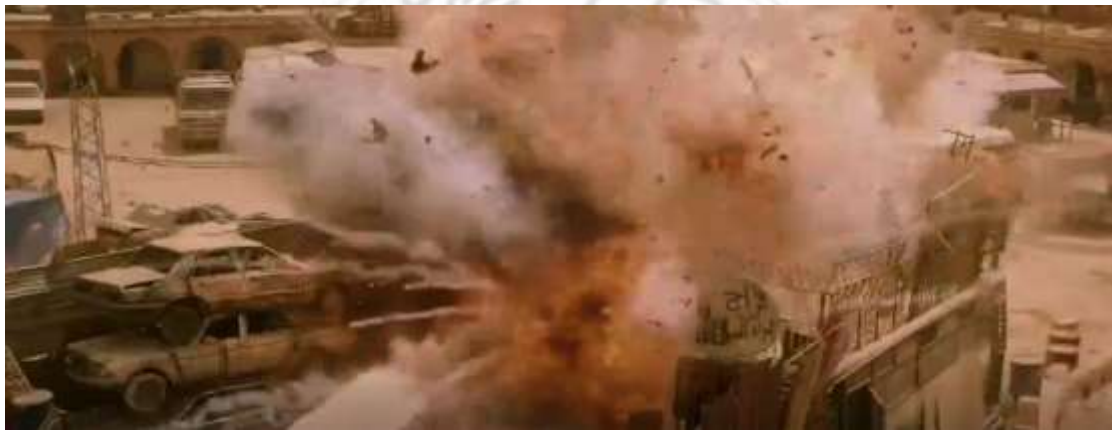
圖 4.10 升降鏡頭-1

攝影機於拍攝時不斷變換高度和角度，給閱聽人產生不同感受，時常用於表現事件規模及氣勢或是運動中的人物，如圖4.10至4.12，同一時間，攝影機利用不同角度及高度，拍攝戰場上各處爆炸狀況，讓閱聽人感到戰場中震撼效果。