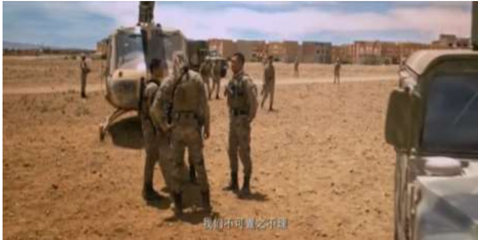
圖 5.61 中國認為此事影響國際無法置之不理