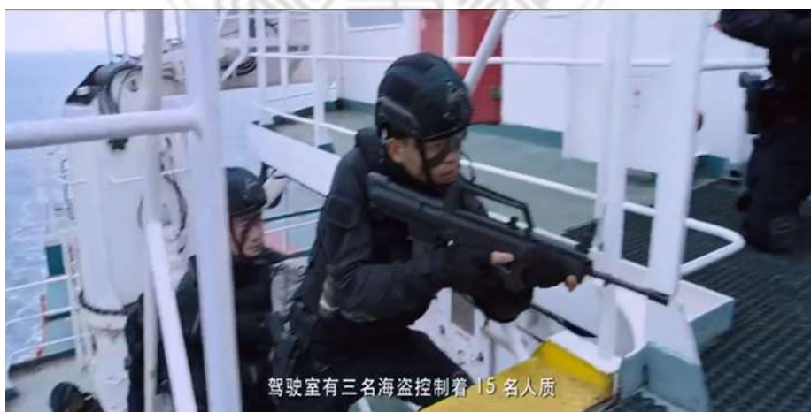
圖 5.1 95 式自動步槍

潛能力，為目前中國主要海軍護艦之主要戰力之一，在電影中，它的副炮選用 1130 型近程防空炮(圖 5.6)，為中國自製加特林式自動原理近程防禦武器，透過此炮來遏止恐怖組織之導彈。071 型綜合登陸艦中國運此船載運官兵及裝備，可容納四架直升機，甲板亦可提供直升機起降 99 (圖 5.7)。726 型氣墊登陸艇(圖 5.8)可以說是與 071 型綜合登陸艦相結合，071 型綜合登陸艦為 726 型氣墊登陸艇母艦，時常被運用於遠洋作戰，可以快速支援作戰兵力或作戰裝備。電影中最後出現的海軍裝備—39 型潛艇(圖 5.9)，為中國水下作戰重要武器之一，可以於水下遠距離發射飛彈，電影中，作戰結束返航途中，由此潛艇伴隨在旁。然而電影中出現不僅於陸軍及海軍作戰裝備，在空軍作戰裝備上，更值得關注，無人機炸彈(圖 5.10 及圖 5.11)，分別出現在海龍突擊隊前往拯救人質路上，遭受攻擊時，使用遙控方式，控制飛行方向，另一幕是在人質營中，為了阻擋恐怖組織前往傷害所有人質，以手擲方式，將無人機炸彈擲出，使其飛向目標後爆炸。此項武器，是美國最討厭的一項武器，美國國防部斥資 3.3 億美元，研發制止無人機炸彈的系統 100 。除了無人機炸彈，另一個空中作戰裝備為無人機(圖 5.12)，出現於沙漠戰爭中，雖然一度出現無動力，但能在惡劣環境中飛行一段時間，且能準確的定位到組員及目標物，並且能發射出一枚導彈，協助突擊隊在沙漠中作戰。