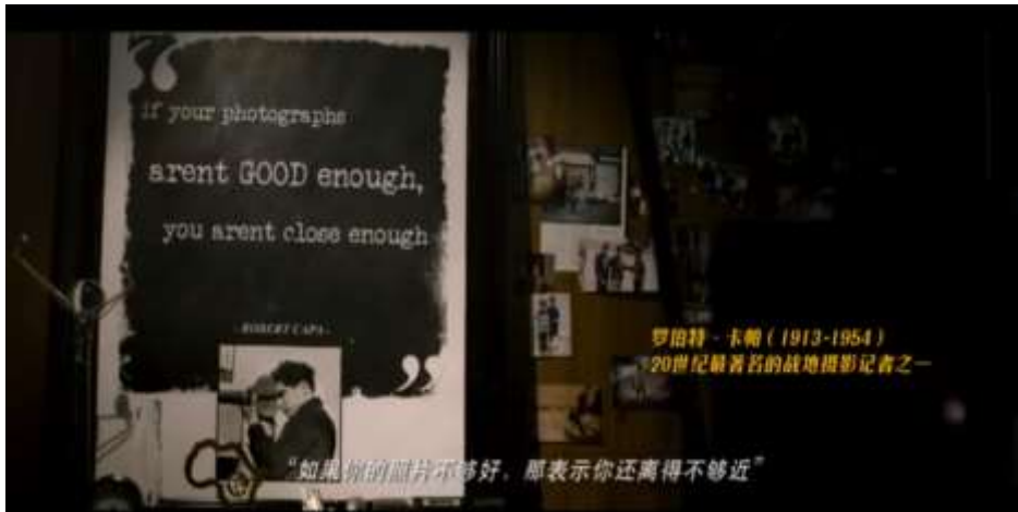
圖 5.35 戰地記者羅伯特·卡帕曾敘述的話