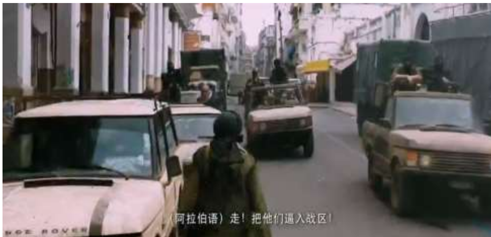
圖 5.17 中國領事等人員遭受叛軍跟蹤