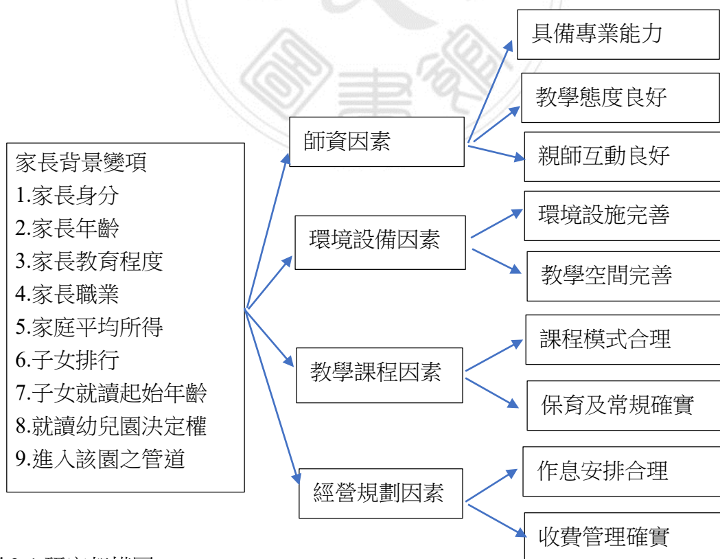
圖 3-1 研究架構圖

本研究將家長選擇幼兒園之因素分為「環境設施因素」、「經營與規劃因素」、「教保服務因素」、「教學課程因素」等四大構面及個別準則。以嘉義縣、嘉義市地區就讀非營利幼兒園之家長為問卷調查對象。研究架構如下圖 3-1