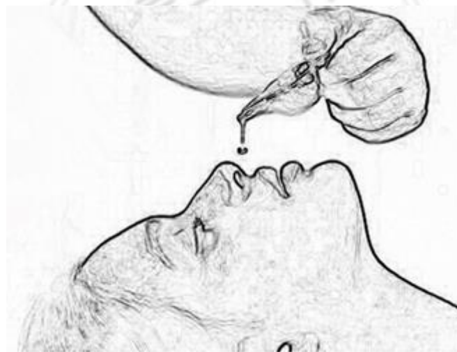
圖 4.1 Nasya 洗鼻法

Nasya 是阿育吠陀重要的治療程序之一，其中藥物給藥途徑是通過鼻子。當藥物（粉末、果汁、湯劑等）或藥油通過鼻孔給藥時，該過程稱為 Nasya。根據阿育吠陀醫書記載，鼻子是通往頭部的門戶，Nasya Karma 是消除 Urdhvangā（鎖骨上區域）受損 Doshas 的過程，確保中樞神經系統的順利運作以及腦細胞的恢復(Goldman, 2006)(圖 4.1)。