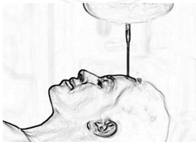
圖 4.2 Shirodhara 額頭藥油淨化療法

澆上微溫的油可以刺激和舒緩下丘腦，從而調節腦垂體的功能並誘導睡眠。Shirodhara 刺激 Marma 或頭部的重要穴位並改善血液循環。Shirodhara 產生恆定的壓力和振動，這時它被額骨中的空心竇放大。然後振動通過腦脊液 (CSF) 的流體介質向內傳遞。這種振動，伴隨著輕微升高的溫度，可能會激活丘腦和前腦基底的功能，有助於將血清素和兒茶酚胺的含量調整到正常水平。用於 Shirodhara 的微溫油也會引起所有通道的血管舒張，從而改善大腦的血液循環，使腦細胞恢復活力，增強記憶力 (Vinjamury et al., 2014)。