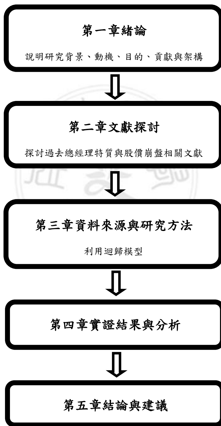
圖 1: 研究架構圖

第一章緒論，包含研究背景、動機、目的、貢獻與架構，第二章文獻探討，第三章資料來源與研究方法，第四章實證結果與分析，第五章結論與建議，根據本研究實證結果提出結論，以及建議未來可繼續研究的方向。文章研究架構如圖一所示：