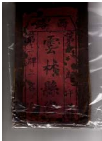
圖十二 清末雲林邑學書包