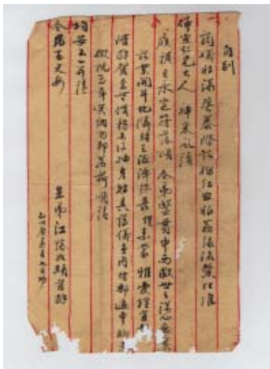
圖五 江藻如詩手稿之一