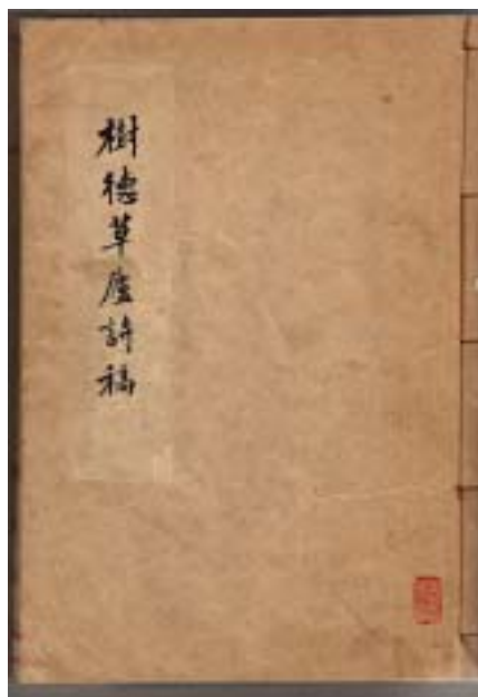
圖七 江擎甫樹德草廬詩稿之一