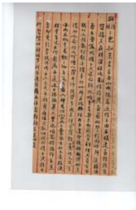
圖六 江藻如手稿之二