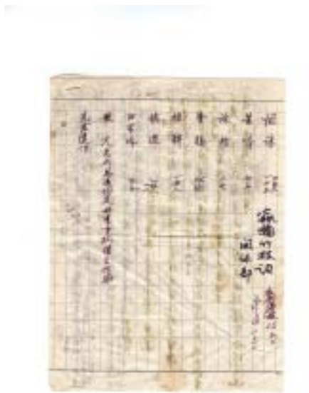
圖九 江擎甫瀛嶠竹枝詞詩稿