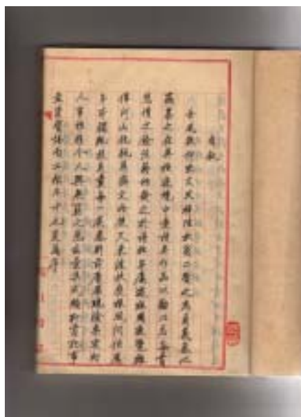
圖八 江擎甫樹德草廬詩稿之二