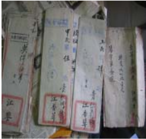
圖十三 清末雲林邑學試卷