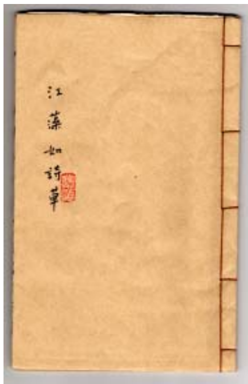
圖三 江藻如詩草書影之一