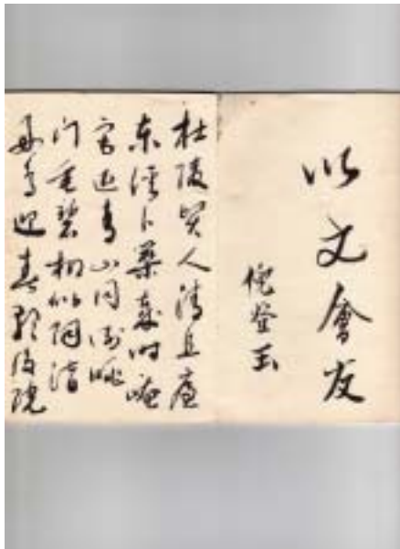
圖十四 莢社擊鉢簽名錄墨寶