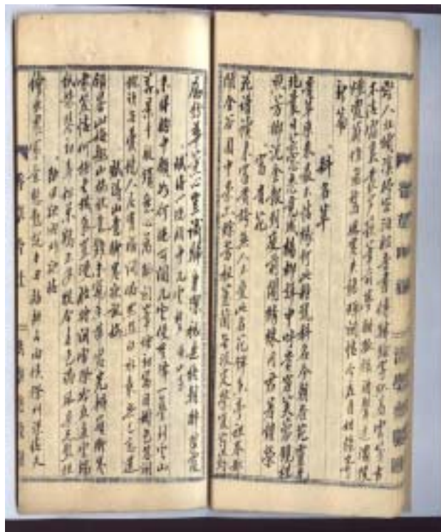
圖四 江藻如詩草書影之二