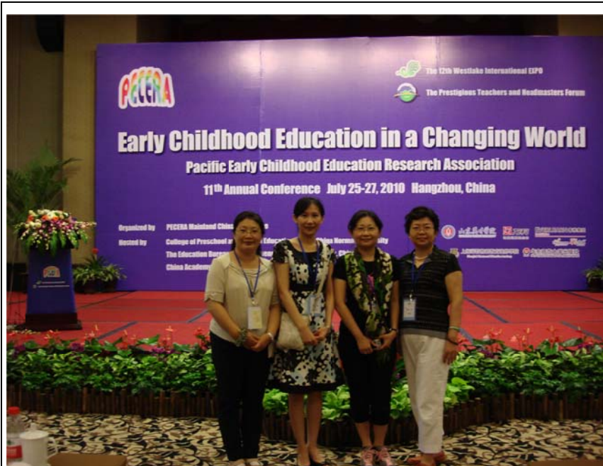
閉幕當天 會場留影