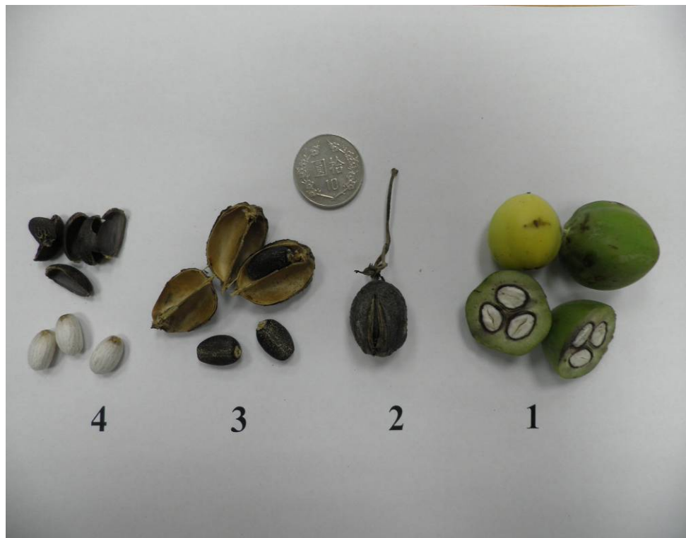
圖三 麻瘋樹蒴果、種子、種仁照片