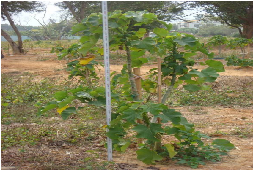
圖四 夏季溫度較高，麻瘋樹樹葉茂密翠綠

福建南安位於中國東南沿海，東經 118^{\circ}10' ，北緯 24^{\circ}58' ，緯度和在北緯 24^{\circ}42' 的苗栗試種地相近。林曉輝在福建南安的麻瘋樹種植報告指出，幼苗在秋冬逐漸落葉，隔年3月份又開始萌芽，長出新葉（林曉輝，2006），與本種植試驗初步結果一致。