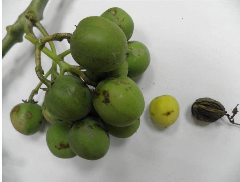
圖二 單枝結 14 個蒴果