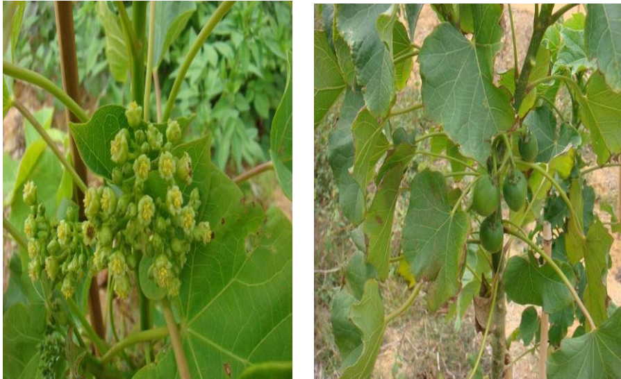
圖一 麻瘋樹於栽種當年度開花結果

圖一顯示麻瘋樹於當年度開花結果。麻瘋樹的花常見形成於枝條的頂端，一般雄花和雌花著生在同一個花序上，雄花多，雌花少，雌花約佔 3-10% (郭承剛等，2007；何亞平等，2008)。