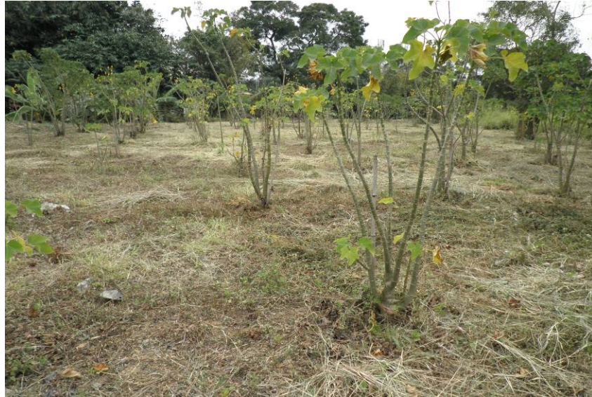
圖五 冬季氣溫較低，在寒流過後，樹葉逐漸枯萎掉落