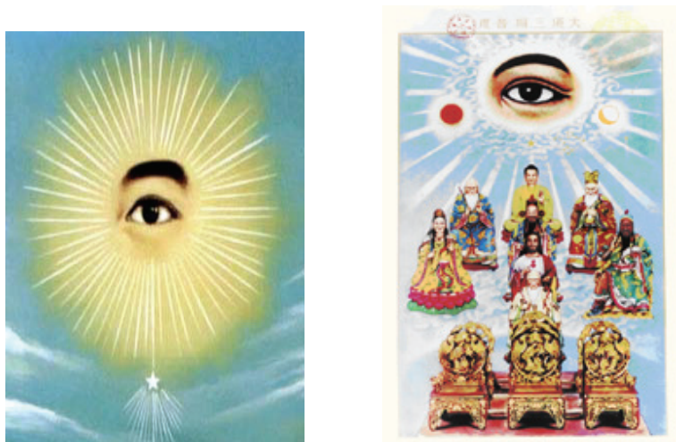
圖 1 高台教的天眼