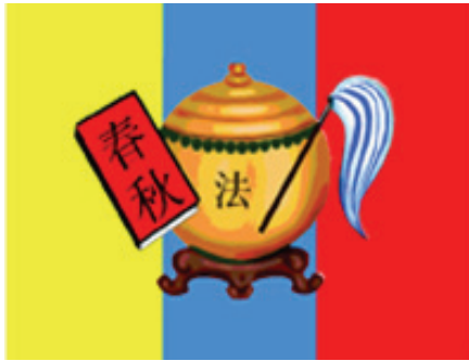
圖 3 高台教的三清教旗與三教融合的象徵

教、最基本是儒教、中間融合兩端是道教，高台教認為，儒所談的倫理，屬於入世的道德修養，是維持社會秩序與規則的最適合方式；佛的境界，是超越陰陽與宇宙的乾坤的實有，也是至善的終極實體；道之修煉，則在溝通有形世間與無形聖域，亦即修行必需落實於世間的磨練，而非空談玄虛之理；又需有超越的神秘體驗，而非只知現象界而不理解他界諸天仙佛聖賢的存在。因此，三清教旗亦是高台教三教融合的表現象徵。