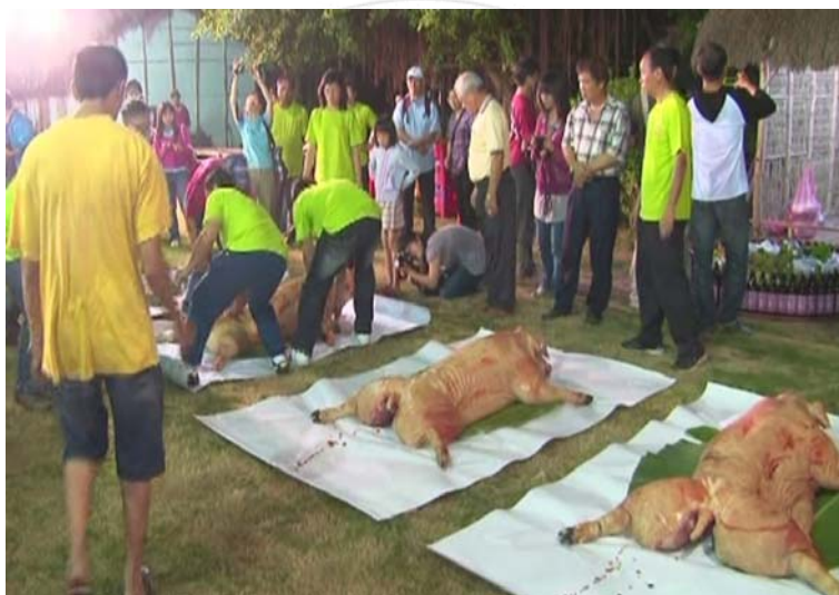
圖 4.2 阿立祖夜祭—獻豬。

擲筊完後，尪姨會以刀背敲打豬頭兩下，並掀開白布，然後祭司會將獻豬翻仰，這就是「翻豬禮」。獻豬翻仰後，尪姨會以刀在豬的口、耳、身體上，象徵性地畫一下，表示獻豬已經被諸神點收完畢。至此，整個夜祭的獻豬禮結束，獻豬會被抬出廟埕，為的是要淨空此地，以進行夜祭的另外一項重要動—牽曲。