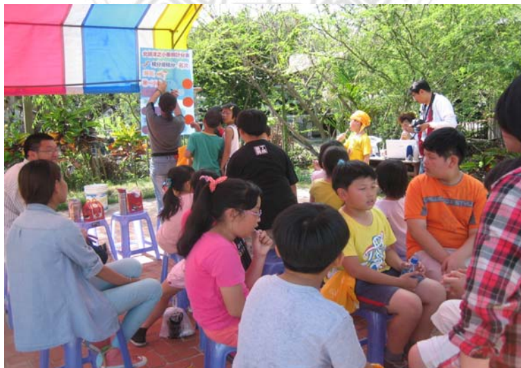
圖 4.11 小番親體驗營。 田啟文攝。

所謂的「小番親體驗營」，主要的參加對象是幼稚園大班與國小學童，人數約在 100 名左右。活動的地點，在北頭洋平埔文化村前的廣場。此一體驗營的舉辦宗旨，是讓小朋友認識西拉雅族的文化，透過實際的參與及學習，讓西拉雅文化可以在幼童的身上播下種子。在這個體驗營中，活動的內容主要有專家學者的演講，介紹西拉雅文化及北頭洋部落；此外，還有西拉雅語的學習與歌唱，還有西拉雅美食（含米買、鹹豬肉、麻糬）的製作；另外，還有以北頭洋部落景觀為題材的繪畫比賽。透過上述的活動內容，小朋友可以在實際的操作體驗中，初步認識西拉雅文化的相關特色與內容，雖然無法非常深入，但基本上已能有某種程度的理解，為其日後更深入了解西拉雅文化奠定基礎。