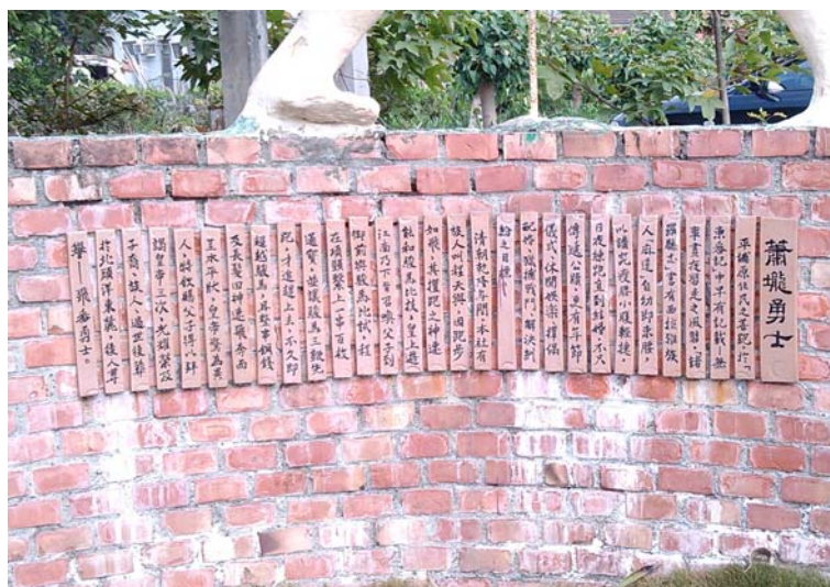
圖 4.8 飛番勇士紀念文。