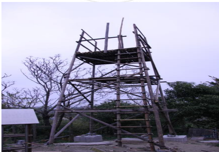
圖 4.10 北頭洋部落望高寮。

望高寮在今日雖已不具偵測敵情的作用，但其高度卻是眺望四周景色最好的地點。望向東方，平原廣闊，山巒疊翠，感覺此處宛如世外桃源一般，令人心胸開朗萬分。