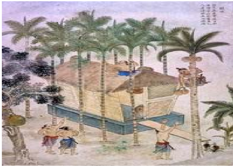
圖 4.15 獠採圖（資料來源:《番社采風圖考》）

等眾多西拉雅社群裡，族人大多都會在住宅的周邊種植檳榔樹，等到每年七、八月之時，就會以徒手攀登檳榔樹的方法，爬上檳榔樹採取檳榔，因而此「獠採」即是代表攀高取食之特殊技巧，因為其動作狀似猿猴，故曰「獠採」。由於此一活動須具備過人的腰力、手力，且須高度技巧，故有「技藝高妙」、「身手矯健」等意象。