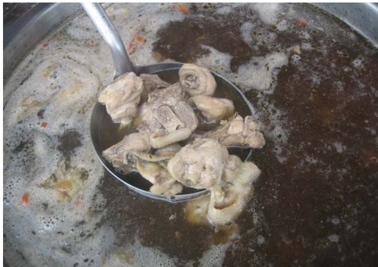
圖 4.18 北頭洋美食—蔴仔雞湯。

加四君子，主要有熟地、當歸、川芎、白芍、人參、白朮、茯苓、甘草等藥材），和雞肉一同熬煮而成。喝來清爽甘甜，有著中藥淡淡的清香，配合足月的土雞肉，令人食後元氣大振，精神暢旺。此蔴仔雞湯，由於以金合歡為主要藥材，這種植物必須生長至少五年以上，其根部與莖幹之療效才能顯著，正由於成熟時間長久，所以此植物異常珍貴，以之熬煮之雞湯，自然也特別稀有。據 C1（北頭洋社區居民）的說法，此一植物熬煮的雞湯，能強壯骨頭，並有增強男性能力的作用；至於女性喝了，也能增強體力，活化肌膚，讓容貌美麗。（見 C1-Q1-01）正因如此，自古以來此湯就是西拉雅蕭壟社族人的聖品。