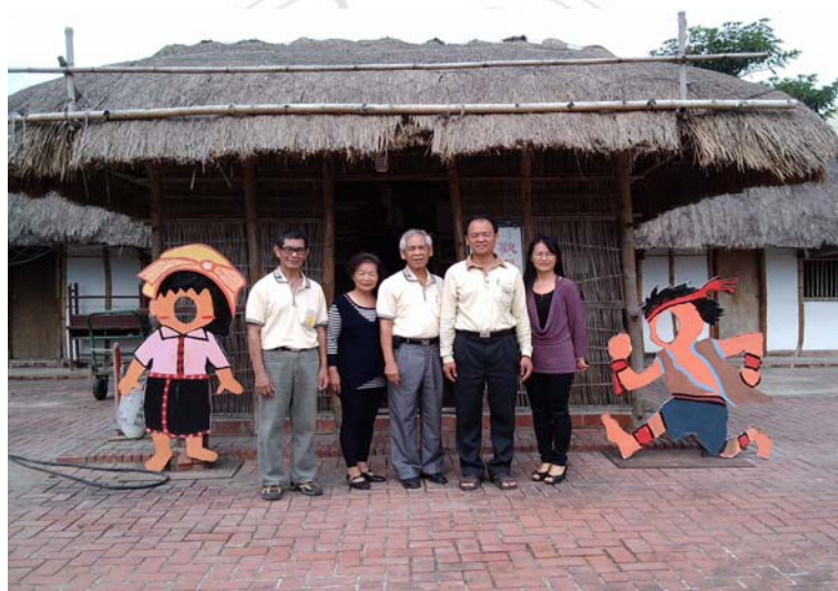
圖 4.5 北頭洋文化館。