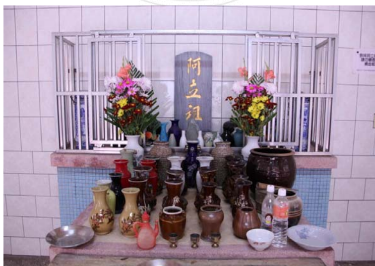
圖 4.1 北頭洋部落阿立祖。

至於六月二十九日的祭典，主要是慰勞向魂，供品主要有粽子、檳榔、酒等三種物品。此日之祭祀主要是受漢人中元普度之影響，希望安慰死者靈魂，然祭品趨於簡單，不似漢人之繁多。最後是九月五日的千秋日，祭典也稱為阿立祖忌，據說此日是阿立祖遇難的日子。然而石萬壽認為，此日應是蕭壟先祖抵達台灣的紀念日。本文認為，石教授之所以如此推論，應是著眼於此日的祭祀，乃位於海邊的番子塢，因此認為應是祭祀先民渡海來臺的日子。此一狀況，類似台南學甲慈濟宮每年皆會舉辦的「上白礁謁祖祭典」。此一祭典，主要是感念來自福建白礁慈濟宮的保生二大帝，當年保護先民渡海來臺的恩澤，因此祭祀的地點就選在當初先民遷台的登陸地點。不過究竟是阿立祖遇難日？還是先民渡台日？仍難有定見。此日的祭祀，雖說地點是在海邊的番子塢，但其實北頭洋公廨內亦有祭典，但與祭者限阿立祖的契子。祭祀時由父母帶著阿立祖契子前來跪拜，祭品通常有酒、檳榔、牲禮、紅龜粿、鮮花、水果等。其祭典儀式很特別，先由契子父母嚼碎檳榔，噴酒獻祭，接著契子行三跪拜禮，父母再拿起代表英雄的圓條型石塊輕撫小孩的頭髮、臉頰，希望阿立祖保佑孩子，他日勇敢強壯，以保衛家鄉。（石萬壽，1990）