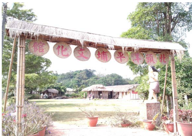
圖 4.4 北頭洋文化館入口處。