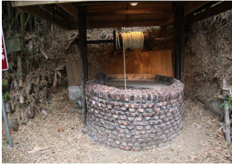
圖 4.9 北頭洋部落荷蘭井。