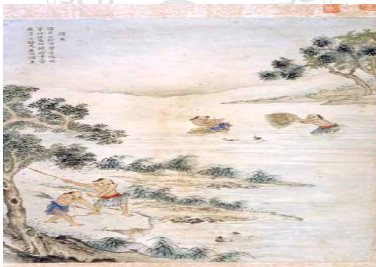
圖 4.14 射鏢圖

在西拉雅蕭壟社的傳統文化裡，眾人使用鏢槍，用來射魚並當作是休閒活動與競賽，就是族人們的休閒活動。在六十七所著《番社采風圖考》裡，清楚記載了西拉雅族人事如何的善用鏢鎗，該書云：「社番頗精於射，又善用鏢鎗，上鏢兩刃，桿長四尺餘，十餘步取物如攜。常集社眾，操鏢夾矢，循水畔，窺遊魚，噉响浮沫，或揚髻曳尾，輒射之，應手而得，無虛發。」有鑑於此，每年所舉辦之「平埔操鏢競技」活動，也是希望可以恢復此一文化傳統，讓社會大眾可以了解本活動之特殊歷史意義。