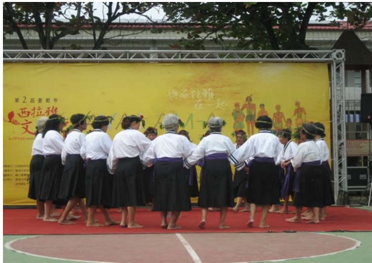
圖 4.12 西拉雅舞團—部落婦女獨舞。