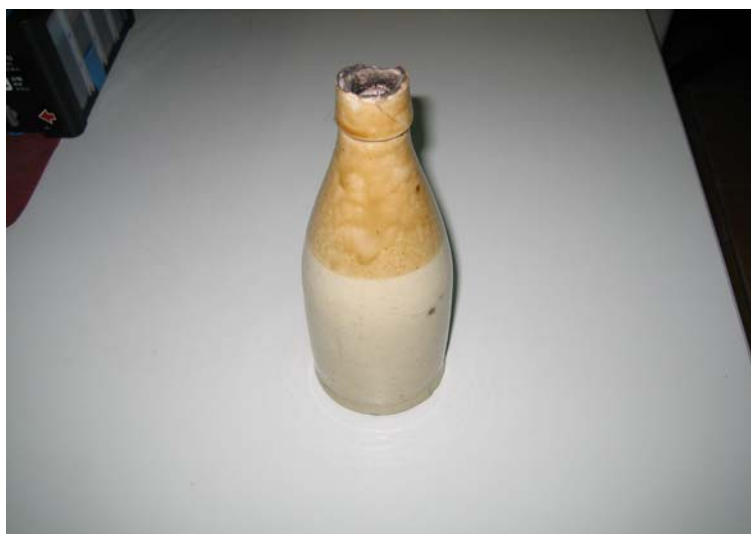
圖 4.20 西拉雅文物—祀壺 2。