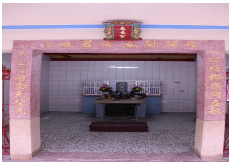
圖 4.6 北頭洋部落立長宮。