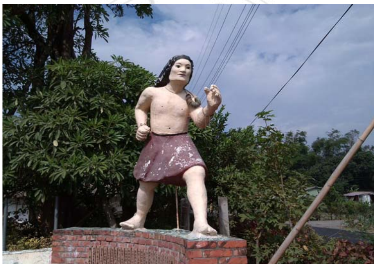
圖 4.7 飛番勇士塑像。

今日在「飛沙崙」東麓的田野之中，細細觀看則可發現兩座約高出地面半尺高的「飛番墓」，一座即為「程天與」的墳墓，墓碑上面明白著刻著「父子面君三次」，另一座則是其兒「程國泰」之墓。由於程天與腳程飛快，連駿馬都望塵莫及，帶著如此傳奇的色彩，也讓其墳塋成為北頭洋部落，甚至是西拉雅重要的文化資源。誠如林清財（2004：14）所言：「飛番的傳奇故事，宛如西拉雅族獨有的光環，歷史以來的記錄，總被理解為西拉雅人的事蹟。……因飛番墓的存在，帶給飛番傳奇故事想像與滋長的空間，而飛番傳奇故事，更增添了飛番墓的神祕感和英雄感。飛番墓既然在北頭洋，榮耀理當歸與西拉雅。」正因有此神祕感、英雄感與榮耀感，也讓飛番墓成為觀光客造訪的熱門景點。