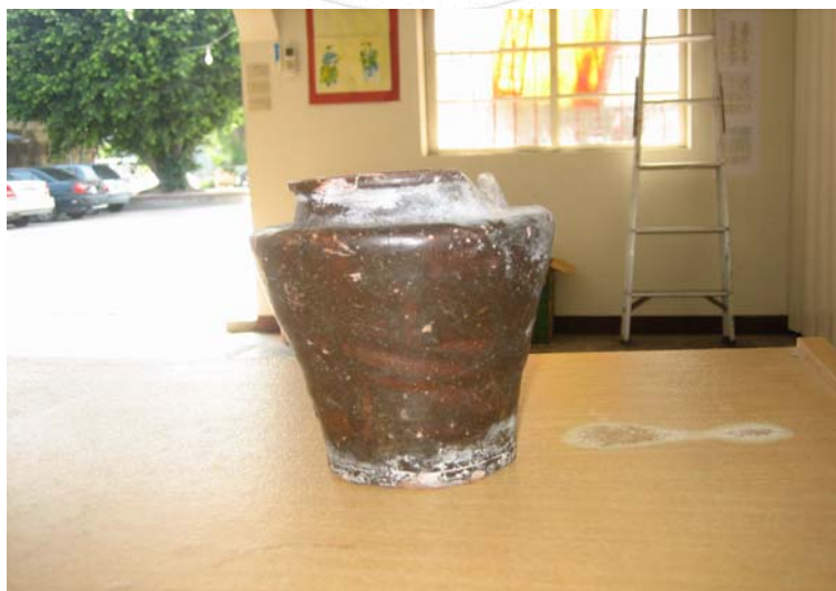
圖 4.19 西拉雅文物—祀壺 1。

透過上述文物，可以在某些層面上了解西拉雅族的生活文化。例如從一堆的竹製品來看，就知道西拉雅人對竹子的使用量極大，關係也至為密切，這應與南部盛產竹子有關，因地緣的關係而大量使用。此外，陶土類製品也相當多，可見陶器的使用，也在西拉雅人的生活中佔有一定的份量。（茲將北頭洋部落的文化觀光資源彙整於表 4.1）