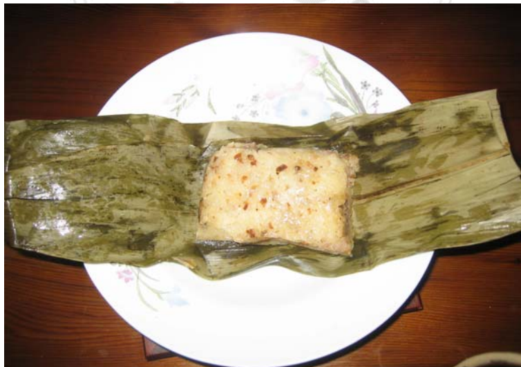
圖 4.17 北頭洋美食—米買。

據 A1 的說法，米買是一種類似粽子的食物，由糯米為主要材料，裡面再包入花生角、肉燥、芋頭（或地瓜）等內餡，將上述食材蒸熟後，再以竹葉包裹，之後進行冷凍，待欲食用時，再行蒸熱而食。