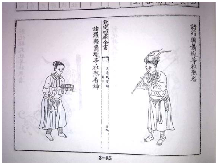
圖 2.1 清代傅恒《皇清職貢圖》之蕭壟社番民圖