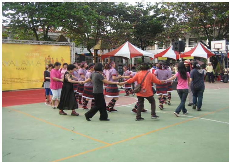
圖 4.13 西拉雅舞團—與社會人士共舞。