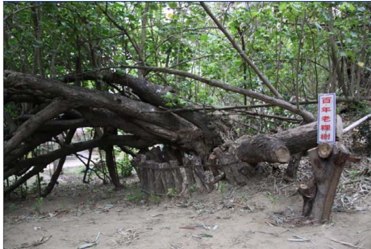
圖 4.16 北頭洋部落檫葉樹。