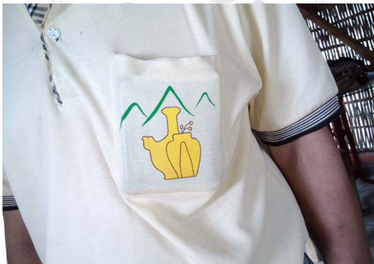
圖 4.21 北頭洋社區識別圖案之一鳥嘴造型之祀壺。

根據北頭洋發展協會幹部 A1 的說法（A1-Q3-08），社區的識別系統主要是飛番勇士的圖案，以及祀壺的圖案。其中祀壺的形狀與西拉雅其他部落的不太一樣，它的瓶口有鳥嘴的造型，壺頸也較長，而且是三支壺並列在一起。至於飛番勇士圖案，主要設置在文化園區的入口處，相當醒目，其實可作為入口意象使用。