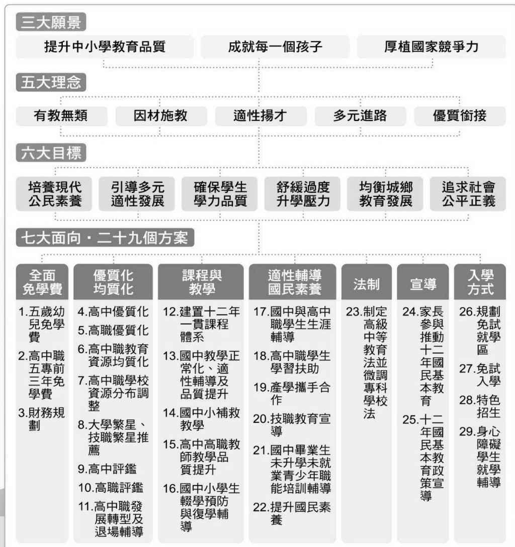
圖 2-1 十二年國教系統架構