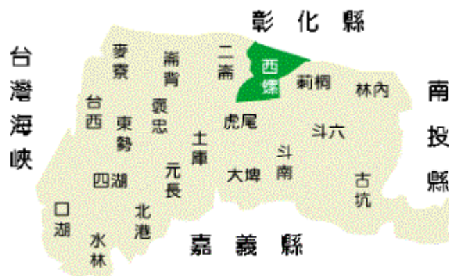
圖 1-2 西螺地理位置圖

延平老街落寞半世紀後，在跨越 2000 年新世紀的凌晨，由螺陽文教基金會結合老街民眾，以「老街新生」跨年晚會掀開延平歷史街區活化保存的工作。2007 年螺陽文教基金會以文建會的「區域型文化資產保存工作」為老街新生尋求解決方案。97 年起西螺鎮公所進行的街道景觀美化工程，雲林縣政府的東市場整修工程及 30 間老街屋立面及騎樓空間整修等等，讓西螺老街呈現出人文歷史氛圍，接續的工作仍然很多，社區居民的觀望仍在，但是我們已可以認為，老街的頹勢已止住。「悠遊慢活的人文生活空間」是我們對此街區期待的目標；下圖分別為西螺地理位置圖以及西螺文化景點導覽圖。