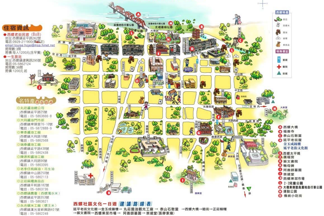
圖 1-3 西螺文化景點導覽圖