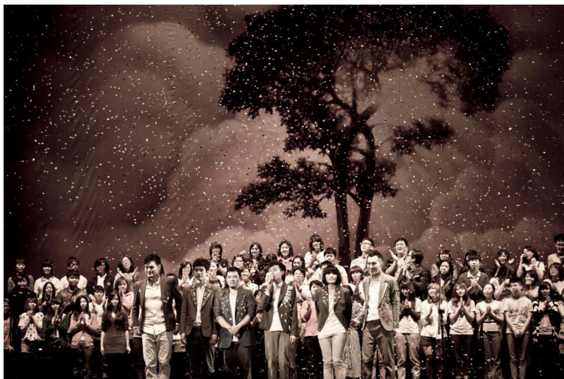
圖 1 2012 年蘇打綠「當我們一起走過」演唱會尾聲，團員與打粉們在舞台上大合唱〈你在煩惱什麼〉 89

打粉躍升為舞台上的表演者，手牽手和團員一起合唱、隨著旋律踏步、搖動、歌唱，經媒體攝影、報導，留下歷史性的畫面，如圖 1。在大眾文化研究中，圖片、符號都可被當成研究的對象文本，能很清楚地以圖像的形式，說明打粉與蘇打綠共同進行展演當時的真實情狀。