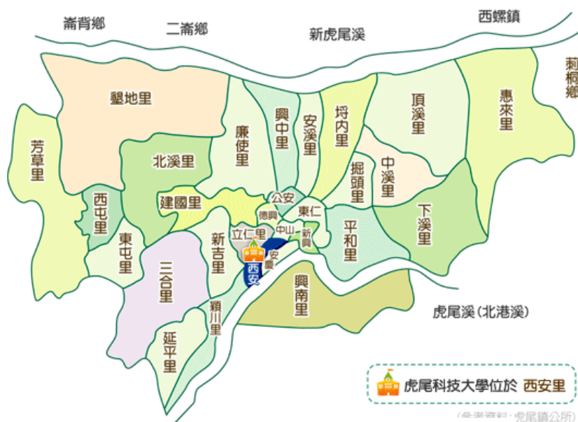
圖 1-1 虎尾鎮行政區域圖

http://www.huwei.gov.tw/content/index.asp?m=1&m1=3&m2=12