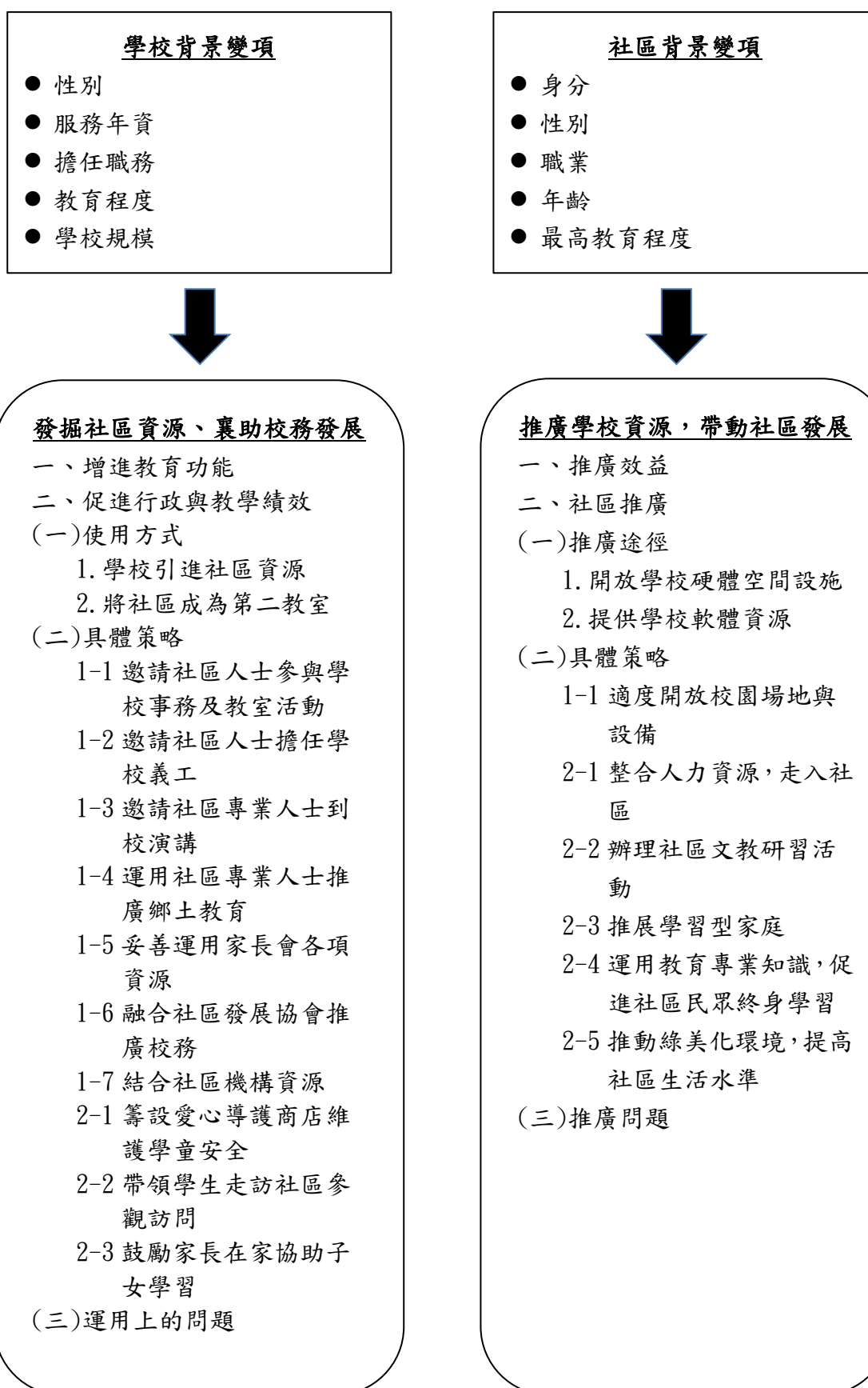
圖 3-1 研究架構