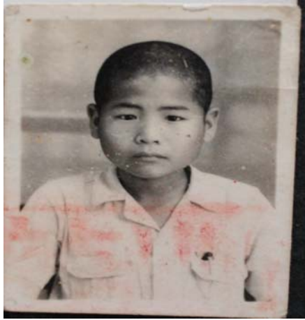
曾人口唸公學校時期畢業照