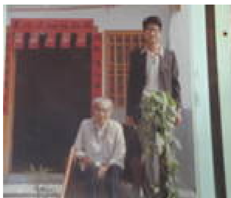
人口與母親陳于老夫人合照