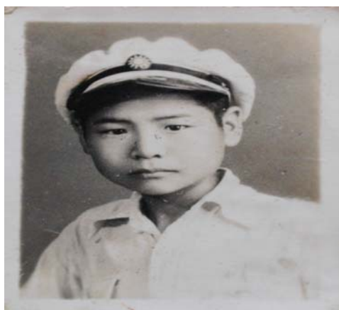
曾人口唸北港初農，時年 13