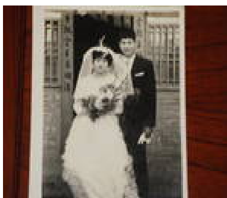
曾人口與呂阿節小姐結婚照