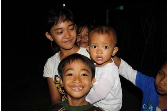
【圖 4.16】內心的體悟 沒有複雜的玩具，享受的生活，卻有爽朗率真的笑容。

“出發前我還做了好多心理建設，因為個人有時很重視衛生，總覺得自己要準備好很大的包容心再出發，沒想到，那兒雖然簡單，但卻稱不上骯髒，雖然沒冷氣，晚上仍是好涼爽，雖然一堆人說有蚊子，但我卻從來沒被叮過(哈哈)!! 那兒一間間矮小獨立的房子是我們少見到的，望出去，可以看到好大一片藍天呢!” (B9, 20 歲, p3 : 7-12)