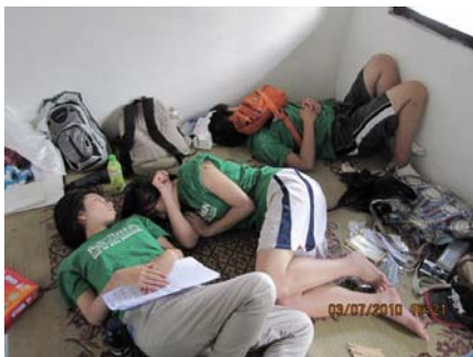
【圖 4.3】克難的環境（3） 志工很快適應環境，即使環境再簡陋也能怡然處之。

研究者的觀察亦發現，面對不便的生活環境，志工們很快便適應並尋找出互相體諒且有效率的空間使用方式，開始能較正向的接受環境的挑戰，並且認為能夠以最貼近當地居民的方式在這樣的環境中生活是件新奇有趣的事，對於自己能夠適應感到十分有成就感，覺得自己能再迎向其他的挑戰。