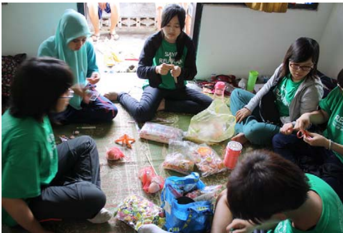
【圖 4.12】志工的互動 (2) 志工們一邊分享台灣與印尼小點心，一邊製作活動器材。

“我覺得跟 A1, 還有跟 Adi 跟 Azis 我們一起，就是每天一起開會，一起討論事情的時候，我學到很多……想法吧，還有一些事情的價值觀。” (B1, 20 歲, p4 : 33-34)