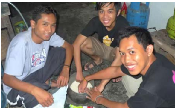
【圖 4.5】食的體驗（2） 印尼志工為我們準備印尼風味餐。