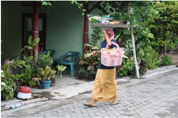
【圖 4.7】食的體驗 (4)