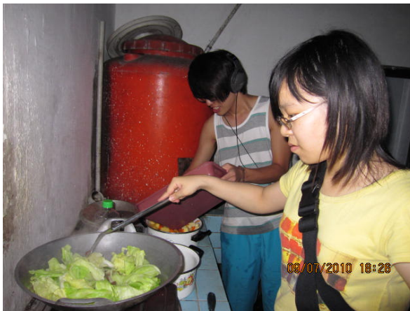
【圖 4.4】食的體驗（1） 每日餐點由志工輪流準備。

“看他們吃台灣東西的時候的表情啊，就是不只是煮飯給別人吃，還是煮給完全不一樣的國家的人吃，他們也是第一次看到，然後吃東西的時候表情滿好玩的。”（B2，20 歲，p1：26-28）