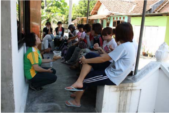
【圖 4.13】志工的互動 (3)

這群來自台灣各地原本互不認識的志工，因為參與國際志工服務而聚在一起，聊著彼此的經驗、未來的夢想。