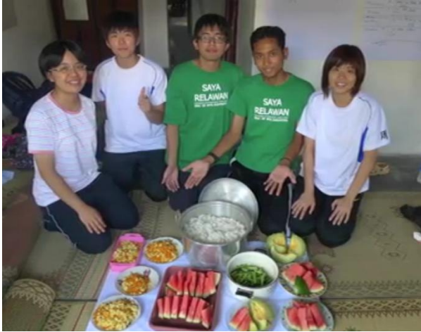
【圖 4.11】志工的互動（1） 雙邊志工營讓大家有更多的機會了解彼此的文化。圖為志工們一同吃著大家輪煮的大鍋飯。

研究發現志工旅遊的時間雖然短暫，但它提供了一個機會，讓來自各地的人成為朋友，得以學習彼此的文化，了解並尊重他人。無論語言是否相通，文化背景是否相同，大家皆能在這個過程中，建立友誼，這是志工旅遊與大眾旅遊十分不同的一大特點。