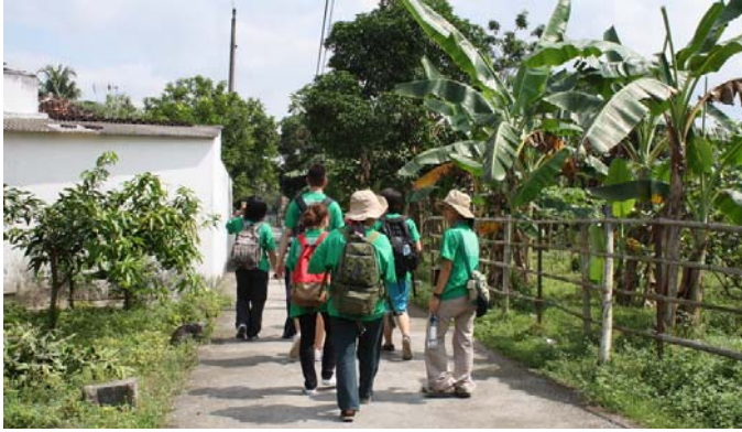
【圖 4.9】行的體驗 (1)

在印尼志工的陪同下，與台灣志工漫步於當地小徑，除可觸及居民真實的生活情境，亦可享受當地的純樸與悠閒。