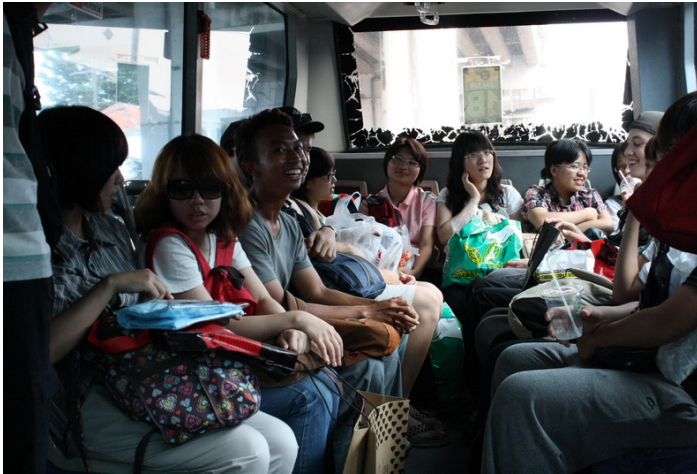
【圖 4.10】行的體驗 (2) 在印尼志工的帶領下，志工嘗試 搭乘當地交通工具的體驗。