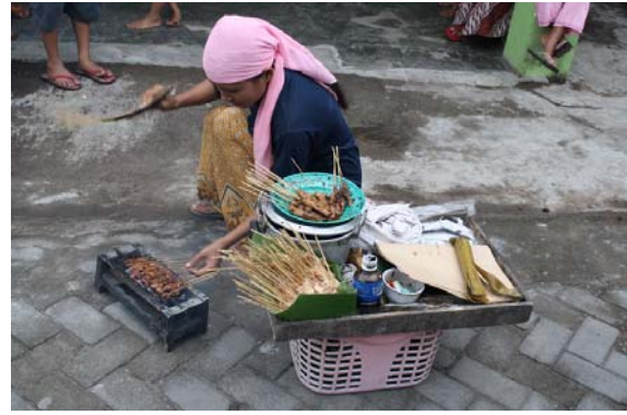
【圖 4.8】食的體驗 (5)