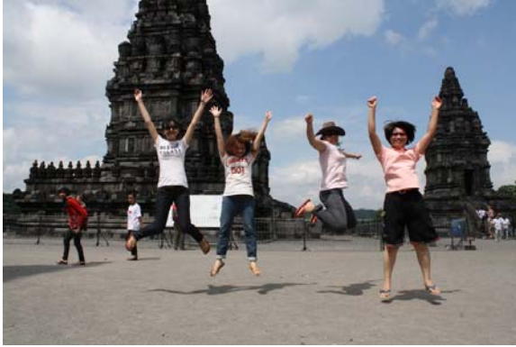
【圖 4.14】志工的互動（4） 志工在志工營中讓視野更開濶並 獲得自我肯定的機會。

研究者觀察發現，與一群陌生人到不熟悉的環境，為同一個目標而努力，對個性較內向的志工而言更具挑戰性。為了與他人互動，必須要試著強迫自己主動接觸他人，經歷自我突破的過程。再者，活動中有機會與其他國家年齡相仿的志工進行交流，對台灣志工而言亦是一種直接且深刻的體悟，從互動的過程中感受到對方的積極與熱情，感受到他人的自主與獨立，引發參與者之深層省思。