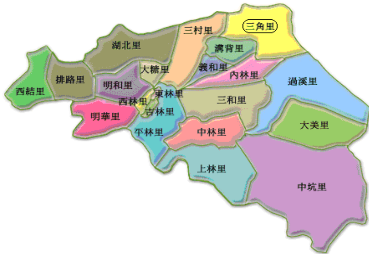
圖二 嘉義縣大林鎮行政地理圖

端，鄰近的鄉鎮有，北邊與雲林縣大埤鄉、斗南鎮、古坑鄉為鄰，東鄰嘉義縣梅山鄉、西鄰溪口鄉，最後南邊連接民雄鄉。大林鎮的舊名有「大莆林」、「大埔林」，地名的由來有兩種說法，一是大林鎮在開墾初期是廣大的森林地帶，另一種說法是，來往大林大多都是由潮州府大埔之林的移民，後來才改稱大林。1920年臺灣地方改制，於10月1日日本地設置「大林庄」，1943年10月1日升格為「大林街」，隸屬台南嘉義郡管轄。1946年設置台南縣嘉義區大林鎮，1985年10月25日行政區域調整改為嘉義縣大林鎮到現在 3 。大林鎮內行規劃區域有二十一一個里，全鎮土地面積為64.17平方公里，人口總數依據大林戶政事務所統計截至民國100年11月為33,219人，其中北勢社區位於三角里行政區域內，人口數為996人。 4 產業發展以一級產業為主，主要種植以稻米、鳳梨、甘蔗、蘭花為主。