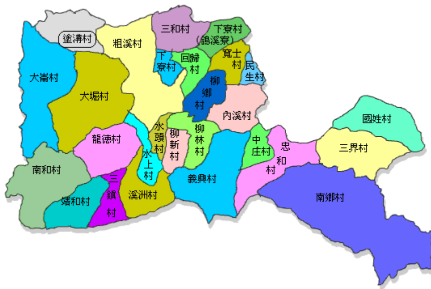
圖四 嘉義縣水上鄉行政地理圖

政區域總共有二十六個村(里)，全鄉土地面積為 69.11 平方公里 8 。人口總數依據水上鄉戶政事務所統計，截至民國 100 年 11 月總人口數為 51,809 人，其中塗溝村人口數為 1,039 人 9 ，主要種植以水稻、玉米、甘蔗、竹筍等高經濟作物為主，另外，畜牧業多以養豬、乳牛、羊、雞、鴨為主。以下是水上鄉的行政區域圖。