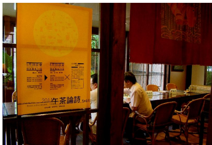
活動場地非常典雅舒適