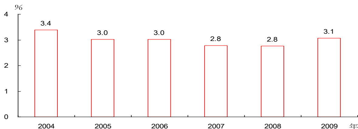
圖 1 跨國婚姻離婚率

為協助婚姻移民帶來的多元文化與本地社會的融合，政府雖成立外籍配偶照顧輔導基金，建構多元文化社會支援，惟跨國婚姻離異對數仍居高不下，2009 年達 1 萬 3,157 對，占外籍配偶家庭 3.1%，表示每百對外籍配偶家庭有 3 對離婚，創近 5 年來新高。