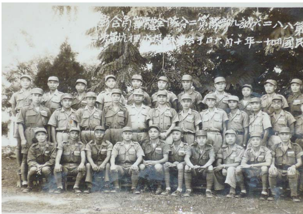
附錄 4-3：民國 41 年軍官戰鬥團駐防南投水里坑與同仁合照