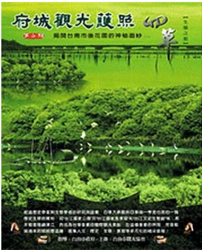
圖 4. 台南市觀光護照圖：(圖片來源：台南市政府全球資訊網站)

(7) 強化行銷功能，建立具有國際觀的古蹟視野，將孔廟文化園區與台南市文化觀光意象有效利用網際網路功能展示於國際觀光市場：