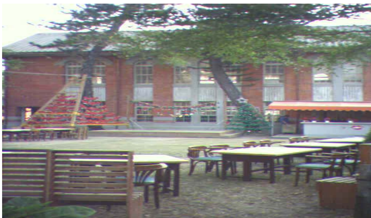
圖 1-3 台南山林事務所現況圖之二