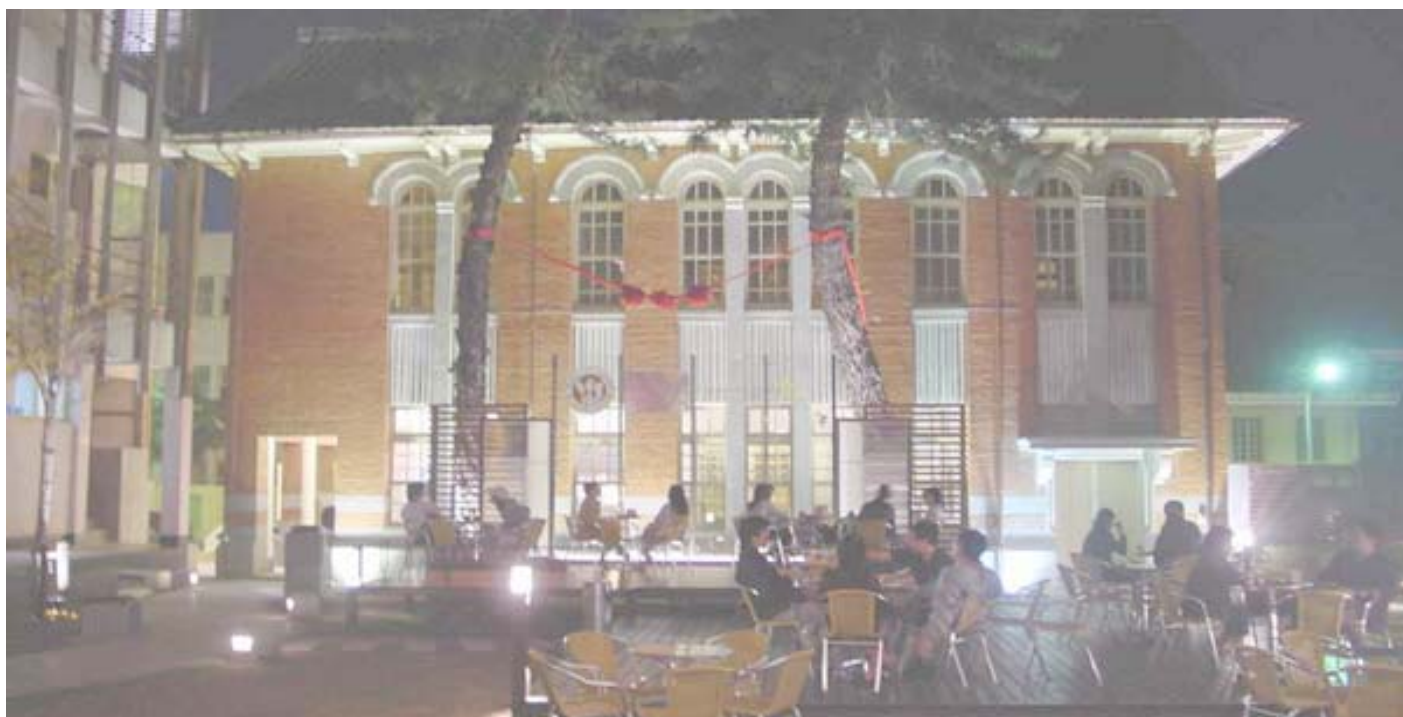
圖 1-2 台南山林事務所現況圖之一：（圖片來源台南市政府文化局）