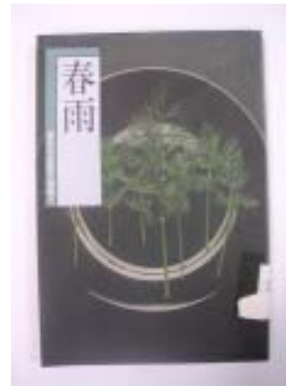
雲林作家散文選集《春雨》