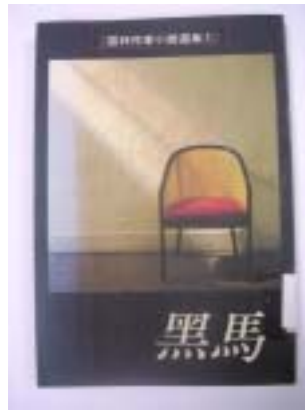
雲林作家小說選集 1《黑馬》