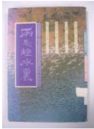
林新居《兩忘煙水裏》