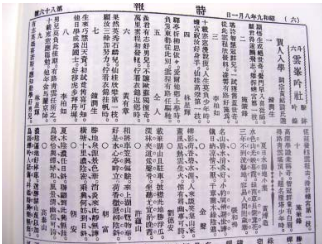
1934年(昭和9年)8月1日《詩報》86號

忽聽文星隕夜半，滿城桃李一齊悲。 淒然大雅扶輪者，此後雲林剩有誰。 門牆得列來年半，顏色瞻聆未十回。 滿望千秋憑誘掖，忽聞仙去最堪哀。 哭師獨自倍淒其，棄我何偏東值時。 無復騷壇瞻顏色，憑誰甲乙再評詩。