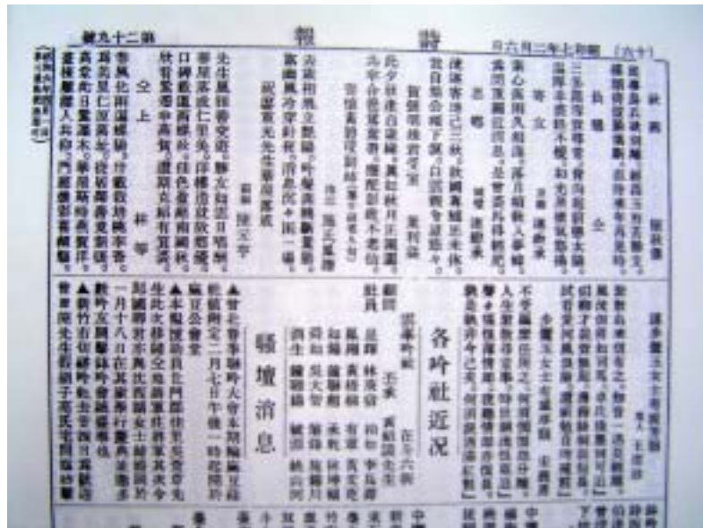
雲峰吟社的近況刊載於 1932 年 2 月 6 日第 29 號的《詩報》。