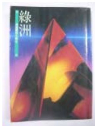
《綠洲-青溪雲林文粹 2》