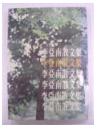
李亞南《李亞南散文集》