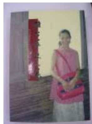
趙台萍《趙台萍散文集》