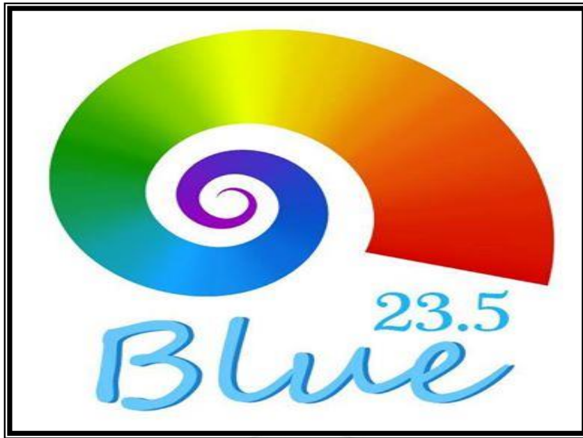
圖 2-1 23.5 蔚藍民宿標章