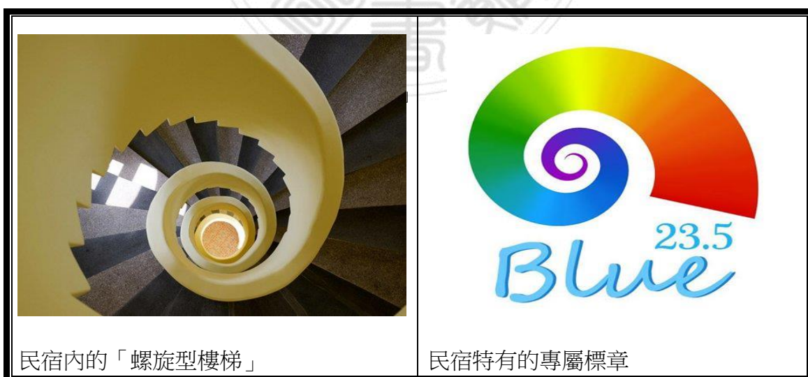
圖 4-3 23.5 蔚藍專屬標章