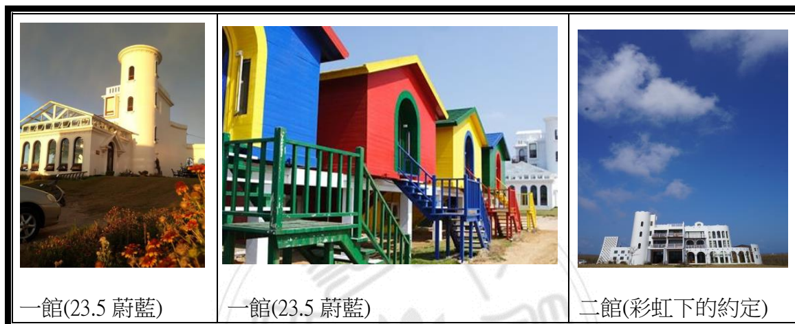
圖 4-1 23.5 蔚藍建築圖

民宿主人一家人，共計有五人為建築、美術、音樂及設計等相關學系畢業，皆具文創相關專長。例如在建築方面，一館及二館均為男主人其獨自設計，整體造型特殊，具建築獨創性及藝術性(如圖 4-1)