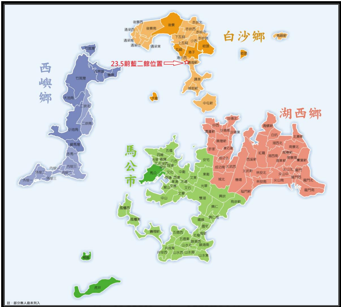
圖 1-1 23.5 蔚藍民宿二館位置圖