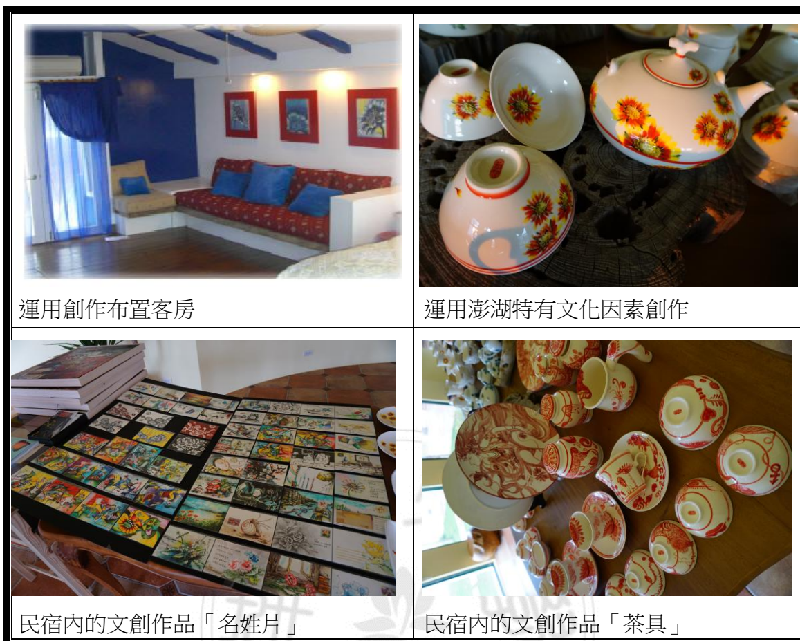
圖 4-2 23.5 蔚藍文創作品