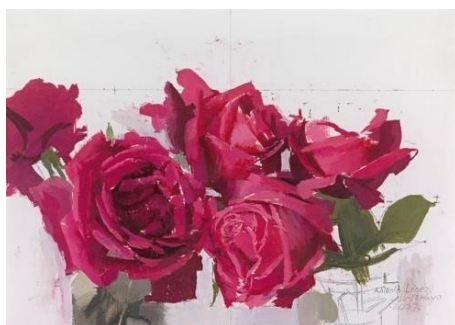
Rosas, rosas, 2007. Óleo sobre lienzo, 51 x 48 cm

En los últimos años el tiempo se hace dueño y señor de las imágenes. Entramos en una época en la que se apodera de los mismos cuadros, inacabados. El número de pinturas sin finalizar aumenta considerablemente.