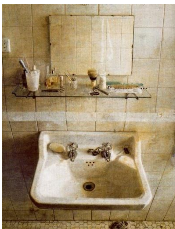
Lavabo, 1967. Óleo sobre tabla, 98 x 83, 5 cm

La representación del paso del tiempo será un rasgo formal de sus obras que se irá acentuado a lo largo de las distintas etapas artísticas. Esta representación del tiempo lo hace a través de una serie de imágenes decadentes que reflejan actos cotidianos como: la enfermedad, el invierno, el lavabo, lo que ha quedado de la comida, la pila con la ropa en remojo, a medio lavar, los objetos cotidianos, usados y solo presentes para su uso, etc. A pesar de ello, estas obras trascienden gracias al enorme detallismo fotográfico con que construye la realidad.