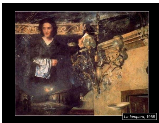
La lámpara, 1959. Óleo sobre tela, 100 x 130 cm