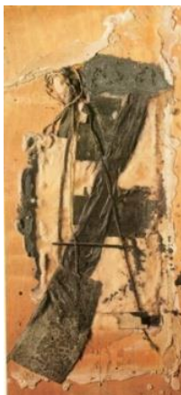
Trapos y cordeles sobre tabla, 1967. Assemblage sobre tabla, 110 X 53 cm

Tapies, se vio influenciado por el Pop- Art, y comenzó a integrar en su pintura matérica objetos del entorno cotidiano, a pesar de que estos quedaron siempre supeditados al conjunto informal. No obstante, dichos objetos no tenían la misma función que en el Pop- Art, donde son utilizados para hacer una banalización de la sociedad de consumo y los medios de comunicación de masas. En el caso de Tapies, siempre está presente el sustrato espiritual, la significación de los elementos sencillos como evocadores de un mayor orden universal.