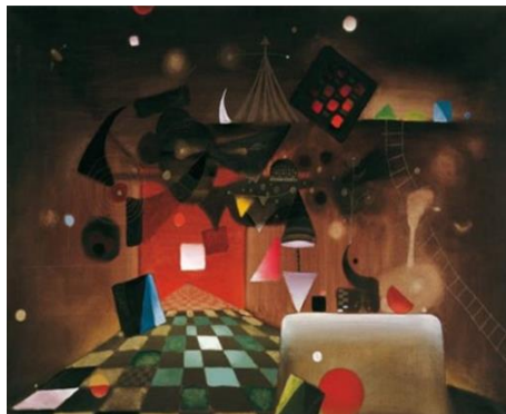
Parafaragamus, 1949. Óleo sobre tela, 82 x 116 cm.

Al poco tiempo efectúa una serie de “collages” con cuerdas y cartones en los que introduce elementos no pictóricos, signos y grafías de diverso carácter. En estas obras concibe el espacio como una superficie en la que pegar los materiales del collage, sobre la que pintar, raspar, etc. La imagen surge de la combinación y asociación de diversos materiales y todos los componentes que en ellas aparecen adquieren la misma relevancia dentro del cuadro. Todos estos rasgos formales anuncian ya su trabajo posterior.