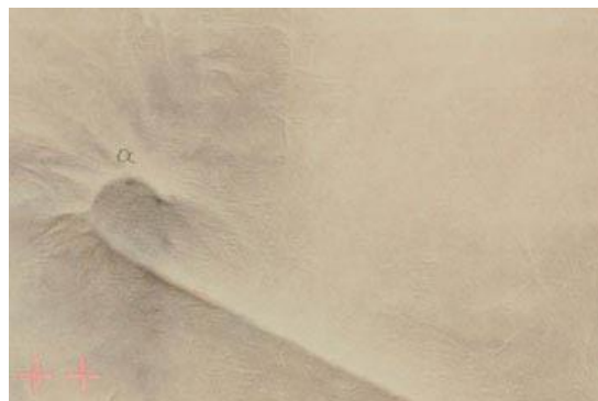
Efecto de bastón en relieve, 1979. Técnica mixta sobre ropa y tela, 139,5 x 112 cm.

Tras un largo periodo de crisis en el que se puede afirmar que la reflexión impera sobre la ejecución, la escultura y el grabado fueron su principal foco de atención. Tàpies retoma su trayectoria pictórica a inicios de los años ochenta volviendo a un cierto informalismo. En la pintura de esta época, se aprecia el influjo de su etapa informalista, sobre todo por el gusto por las materias con calidades texturales y la construcción de objetos esenciales para el pintor. Pero ahora, estos objetos se sitúan detrás del lienzo, no superpuestos encima de él como en épocas anteriores. Su obra tiene características más orientales (aunque el pensamiento oriental va a ser determinante en su trabajo desde sus inicios), y continúa con la reivindicación y espiritualización de lo humilde y la continua transformación de la materia. Sin embargo, en esta década apuesta por formas más abiertas, caóticas y manchadas, con un mayor expresionismo.