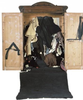
Armario, 1973. Objeto – tapiz, 231 x 201 x 156 m

El uso de esos materiales hace que se le considere a Tàpies como un precursor del Arte Povera, aunque nuevamente hay que remarcar la diferencia conceptual de ambos estilos.