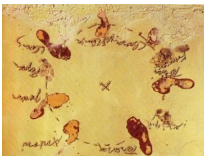
Sardana (círculo de pies), 1972. Técnica mixta sobre tabla, 97,5 X 130 cm

La obra de Tàpies también está relacionada con acontecimientos políticos y sociales del momento, con su compromiso político contra la dictadura franquista, su estrecha relación con el movimiento obrero y el apoyo al nacionalismo catalán.