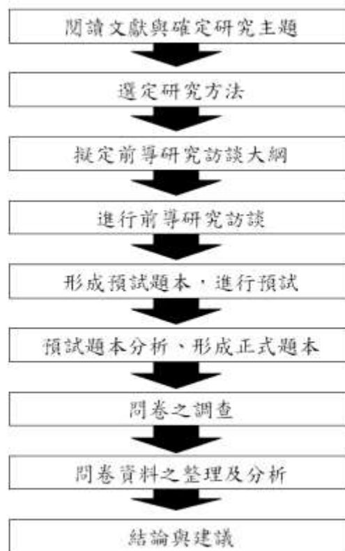
圖 3-5-1 研究流程