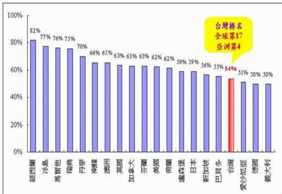
圖2 全球上網人口普及率排名