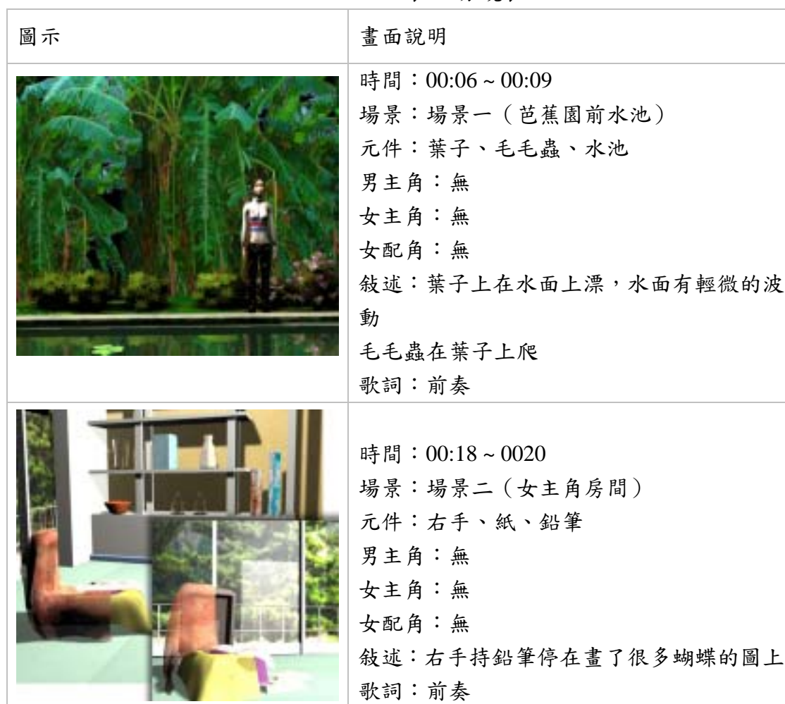
表 3 分鏡表

當主題決定之後，接著就進行劇情與表現的手法之討論，接著完成較正式版書面的腳本製作，本研究利用 Access 資料庫的設計製作腳本，把每一個場景的裡的物件和人物做搜尋，讓上我們製作者在尋找物件和檢視動畫人物的編排上有很大的貢獻也減少製作的時間。例如表 3，腳本分鏡表。