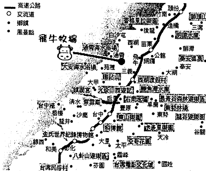
圖2 飛牛牧場位置圖

中部酪農村-飛牛牧場，面積約為55公頃，背倚火炎山，地處南勢溪上游，位於苗栗縣通霄鎮與三義鄉之間，在行政區域上隸屬於通霄鎮南和里，其主要之聯外道路為東西向的121號縣道，銜接台一線縱貫公路，向東南離三義交流道約20公里，往西北離通霄鎮市區約10公里(如圖2所示)。牧場海拔高度為介於120公尺至300公尺之間的丘陵地形，多變的緩坡地型是飛牛牧場最大的特色。牧場內以乳牛養殖為主，農場外並有水稻、茶園、及鳥類、蝴蝶等自然生態景觀，夜間則有極佳的天文景象，再加上該區附近工商活動少，污染程度甚低，環境品質良好，擁有滿足遊客需求之遊憩資源與景觀，是個從事戶外教育與自然體驗的好場所。該地區包含了豐富的動植物自然生態、文化史蹟資源及完善的休閒遊憩設施，如乳牛、綿羊、鳥類、小馬、小白兔、蝴蝶、昆蟲、挑鹽古道、有機農園、草原、餐廳、會議中心、小木屋、乳製品展示區等。