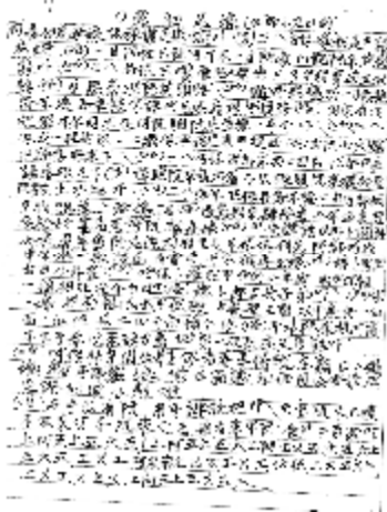
圖 19、雙人表演當初未嫁口白譜例