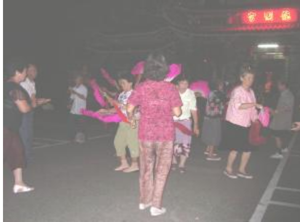
圖 6、以圓的形式來跳

而這個團體所演出的地方是在龍湖宮前的廣場，這個廣場不但是該地區活動的地方，白天更是早市攤販集中的所在地，經詢問過當地人後得知，此地的市集約在早上 4~5 點開始營業，一直到 7 點過後才陸續的收攤或轉到別的市集去營業 (圖 7、圖 8):