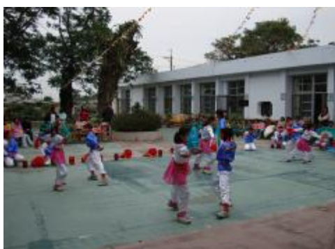
圖 35、「角」持四塊與「旦」對弄