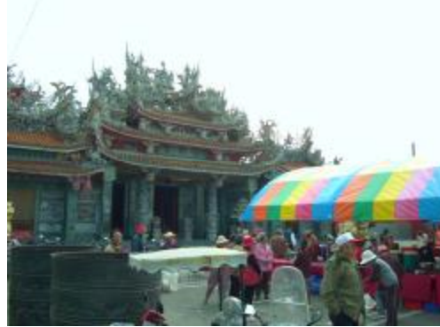
圖 3、利用社區補助金所舉辦的康樂活動 2