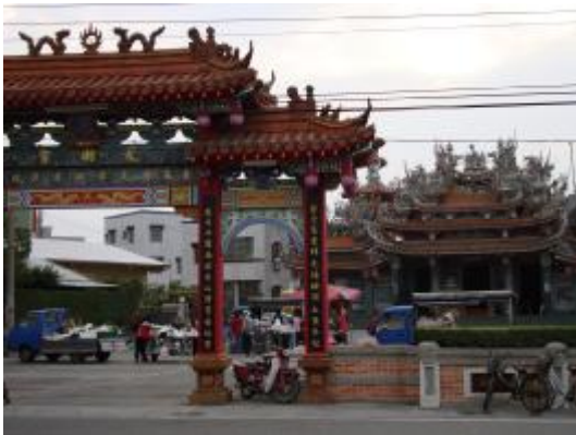
圖 7、鹿草車鼓陣練習場地情形(早上)

而這個團體所演出的地方是在龍湖宮前的廣場，這個廣場不但是該地區活動的地方，白天更是早市攤販集中的所在地，經詢問過當地人後得知，此地的市集約在早上 4~5 點開始營業，一直到 7 點過後才陸續的收攤或轉到別的市集去營業 (圖 7、圖 8):