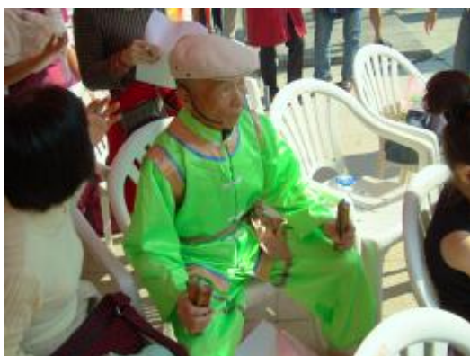
圖 43、公視「就是愛唱歌」表演比賽前準備

在參加民俗比賽活動來說，有縣政府所舉辦的和電視台所舉辦的兩種型式，這次的比賽是由公共電視為了製作電視節目「就是愛唱歌」所舉辦的歌唱比賽節目，這一次比賽是在嘉義市的中正公園舉辦，以下是一個現場錄影的歌唱比賽節目：