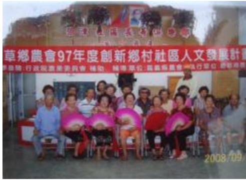
圖 1、參加社區人文發展計畫成員合照