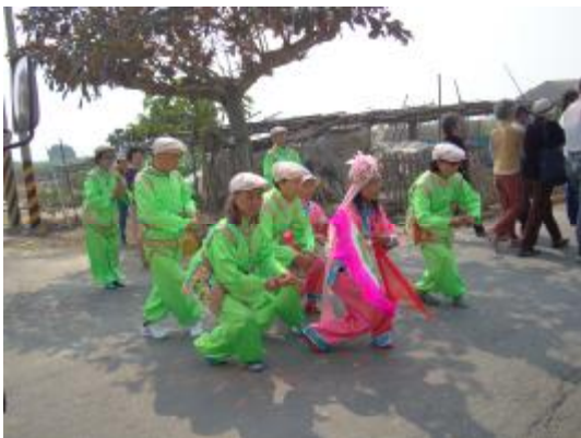
圖 25、向路邊的小廟(五營 7 )表演答謝 1

神明遊街時遇到鄉間小路的廟時所跳車鼓是為了答謝神明(五營將軍)保護當地的辛勞，隊形是旦角各半以兩行的隊形來跳，而跳的方式是以原地雙腳交叉蹲下同時角敲敲阿旦搖扇子，蹲下起來一次(圖 25~28)。