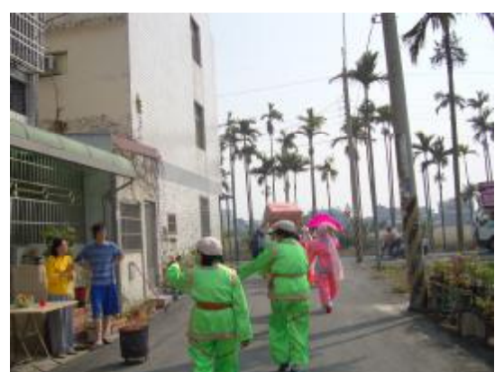
圖 24、車鼓成員與認識的人互動