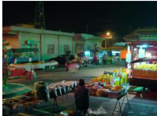
圖 8、市集集散地(早上)

而廟會的活動是每年的農曆 12 月初一到初四，一位擅長旦、角兩種角色的車鼓成員，對於廟會活動提出以下說明: