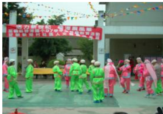
圖 40、老人會車鼓國小演出前定位