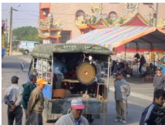
圖 11、鑼鼓樂器車:板鼓、嗩吶、大鑼、小鈸