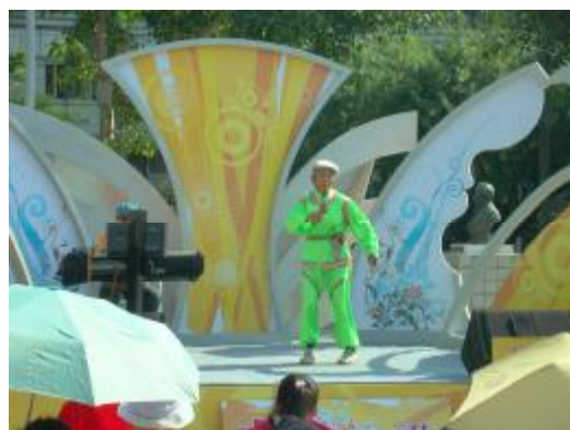
圖 46、公視「就是愛唱歌」表演比賽 1