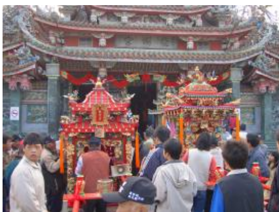
圖 9、龍湖宮:右-三代浮佛、左-清水祖師

在廟會方面，本人記錄了鹿草鄉頂潭村的龍湖宮迎神廟會，這次的廟會，是四年舉辦一次的龍湖宮主神三代浮佛清水祖師聖誕與迎上茄苳媽祖活動一起舉辦(圖 9~12)。