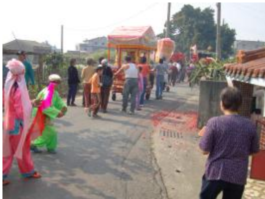
圖 26、向路邊的小廟(五營)表演答謝 2