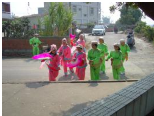
圖 27、向路邊的小廟(五營 8 )表演答謝 3