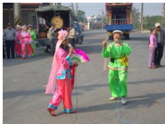
圖 18、媽祖廟前的雙人表演 2

廟前的車鼓團體表演是以平時車鼓練習的形式來呈現出來，在表演當中並沒有加入先前修改的動作，可是並沒有全部走完一輪，差不多只走了 3~4 圈廟會就開始了。