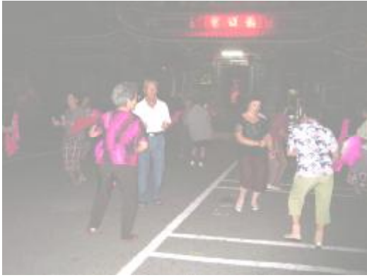
圖 4、鹿草車鼓陣練習情形(晚上)