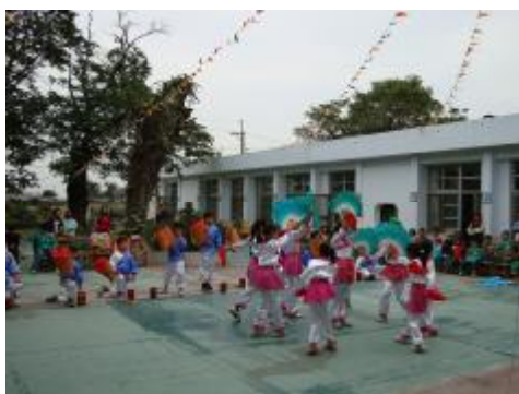
圖 34、國小車鼓「旦」持扇子