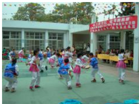
圖 32、手持小鼓、花鼓隊形變換 1