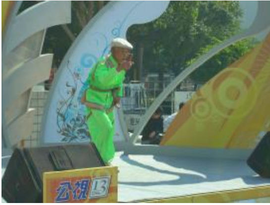
圖 47、公視「就是愛唱歌」表演比賽 1