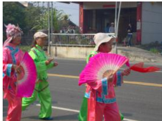
圖 22、遊街時:角邊走邊敲敲仔(台語)且搖扇子