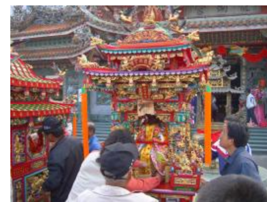
圖 12、龍湖宮主神三代浮佛固定