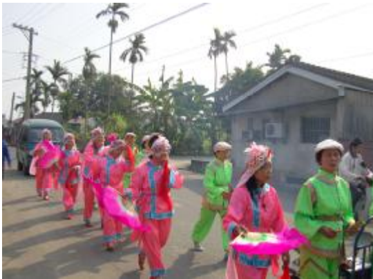
圖 21、遊街時車鼓的表演，角在左、旦在右

在遊街的使用則是以隊形和「角」的敲仔所製造的聲音為主，搭配放音樂的推車，在隊伍中的位置是在天上聖母的後方，整個隊形是角在左且旦在右(男左女右)，角邊走邊敲敲仔，旦則是以橫 8 字形的模式左右搖動扇子和絲巾(圖 21、22)，在走的同時也發生有趣的事，車鼓的成員在遊街時也會遇到熟人，而車鼓成員也會很熱情的問候(圖 24)。