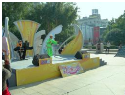
圖 44、公視「就是愛唱歌」表演比賽採排 1