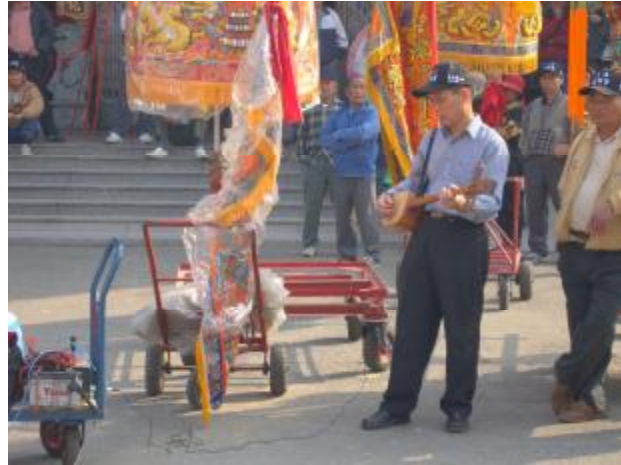
圖 20、雙人表演的三弦伴奏

在遊街的使用則是以隊形和「角」的敲仔所製造的聲音為主，搭配放音樂的推車，在隊伍中的位置是在天上聖母的後方，整個隊形是角在左且旦在右(男左女右)，角邊走邊敲敲仔，旦則是以橫 8 字形的模式左右搖動扇子和絲巾(圖 21、22)，在走的同時也發生有趣的事，車鼓的成員在遊街時也會遇到熟人，而車鼓成員也會很熱情的問候(圖 24)。