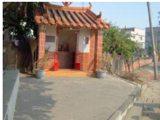
圖 28、向路邊的小廟(五營 9 )