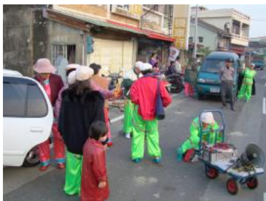
圖 14、放置音樂播放器材的推車

從早上六點左右開始準備迎媽祖和繞境活動，因為這個地方早上還有市場攤販在營業，所以廟方也稍稍的順延一下時間，並沒有一次到定位 5 (圖 13)。而在開始遊行迎駕之前，是車鼓陣表演的時間(圖 15)，在音樂方面則是利用手推車加上播放卡帶的主機與擴音式的喇叭 6 ，接上電源(圖 14)。