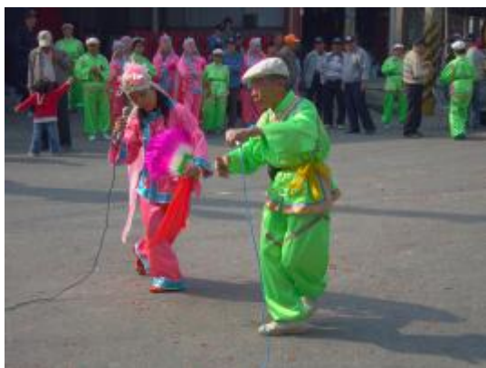
圖 17、媽祖廟前的雙人表演 1

在廟會的車鼓表演本次有以下幾種形式，1.廟前的車鼓團體表演(圖 15)2.廟前的雙人表演(圖 17、18)3.遊街時的表演(圖 21、22)4.隨神明遊街時遇到鄉間小路的廟時所跳的(圖 23、24)四種。