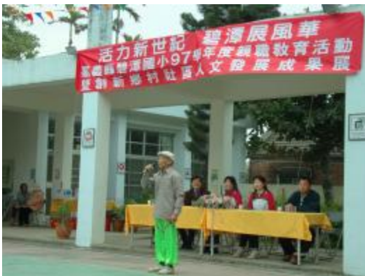
圖 39、林探老師講解說明