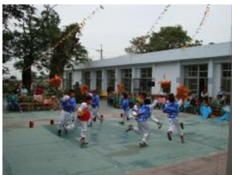
圖 36、「角」持華蓋繞圓圈