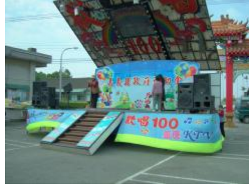
圖 2、利用社區補助金所舉辦的康樂活動 1