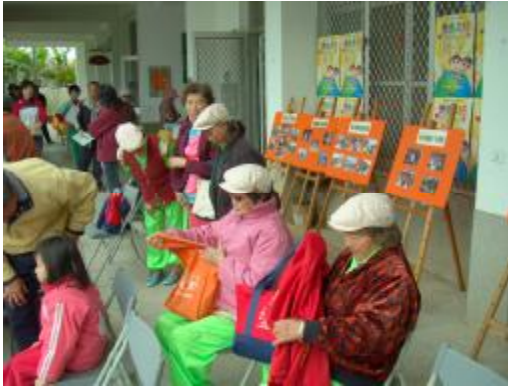
圖 37、老人會車鼓國小演出前準備「角」

另一方面老人會所辦的社區車鼓也會在當地國小所舉辦的活動中演出，也算是一種呈現(圖 37~42):