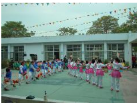
圖 33、手持小鼓、花鼓隊形變換 2