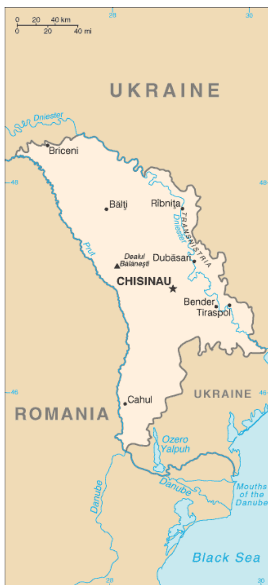
圖 2-4：摩爾多瓦共和國

摩爾多瓦位於歐洲巴爾幹半島東北部多瑙河 (the Danube) 下游，東歐平原南部邊緣地區，絕大部分國土介於普魯特河 (the Prut) 和德涅斯特河 (the Dniester) 之間；其東、北部與烏克蘭為接壤，西隔普魯特河與羅馬尼亞毗鄰；