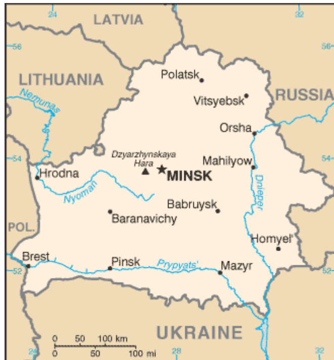
圖 2-3：白俄羅斯共和國

白俄羅斯領土總面積約 20.76 萬平方公里，南北長 560 公里，東西寬 650 公里，邊境線全長 2,969 公里，地處第聶伯河流域，地勢平坦、北高南低，平均海拔 160 公尺，境內丘陵與低地交錯，最高峰為澤爾任斯克山 (Mount Dzerzhinskii)，海拔 346 公尺，最長河流為第聶伯河，其發源於俄羅斯，在白俄羅斯境內河段長約 700 公里。白俄羅斯境內河流、湖泊眾多，星羅棋布，有「萬湖之國」的美譽，最大湖為那拉奇湖 (Lake Naroch)。 55